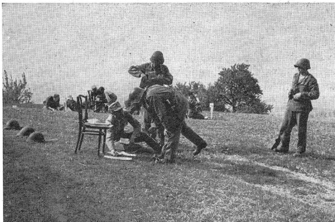
Eine Patrouille erhält ihre Aufgabe auf einem Posten.

Bedauerlicherweise waren als Kampfrichter Stabsoffiziere, die aktive Kommandos haben, spärlich vertreten. Sie scheinen sich für die außerdienstliche Arbeit ihrer Uof. wenig zu kümmern.