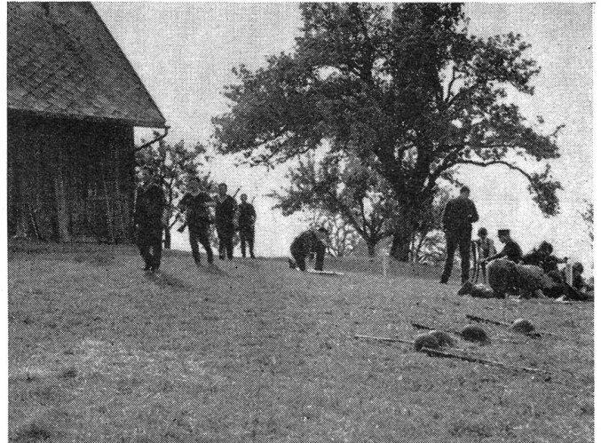
Eine Patrouille erreicht in guter geschlossener Ordnung mit der befohlenen Marscherleichterung den Posten Oberkapf. Eine Patrouille ist bereits mit dem Lösen der Aufgaben beschäftigt.

Eine ständige Kontrolle der Pisten ist unerlässlich. Hierzu eignen sich vor allem Motorradfahrer und Reiter, die wenn möglich in entgegengesetzter Richtung der Konkurrenten zirkulieren. Die Markierungen der Strecken müssen kontrolliert werden und eventuelle «Spione» und Wegweiser sind unschädlich zu machen. Der Zuschauer-