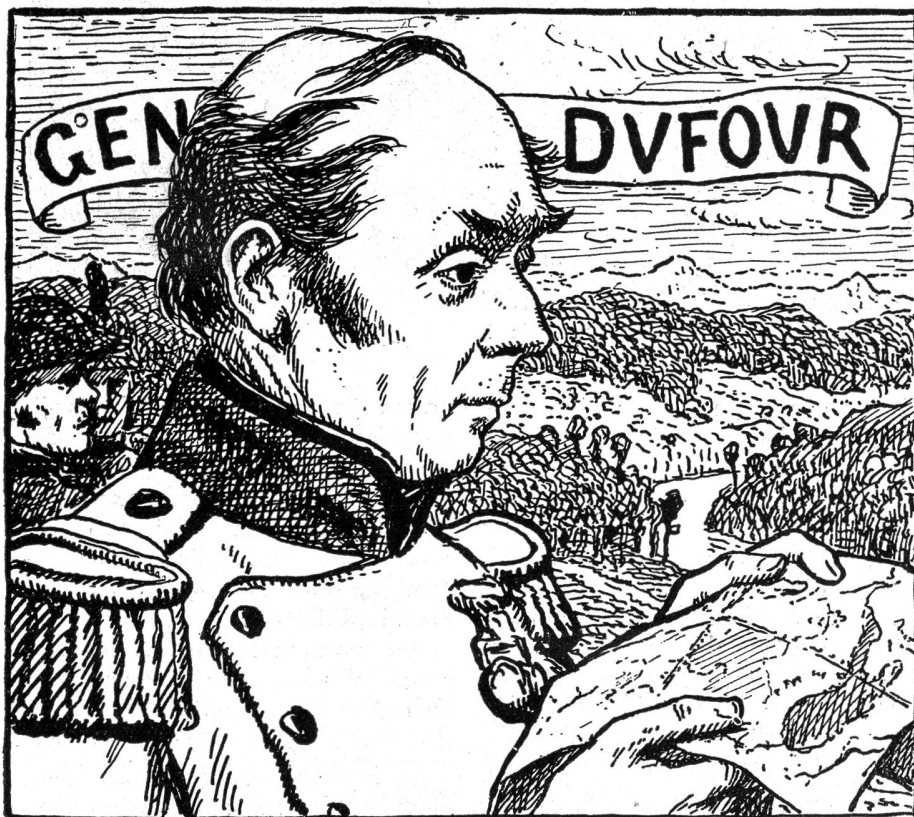
General G. H. Dufour, Oberbefehlshaber der eidgenössischen Truppen im Sonderbundskrieg. — Ehrenmitglied des Eidg. Unteroffiziersvereins