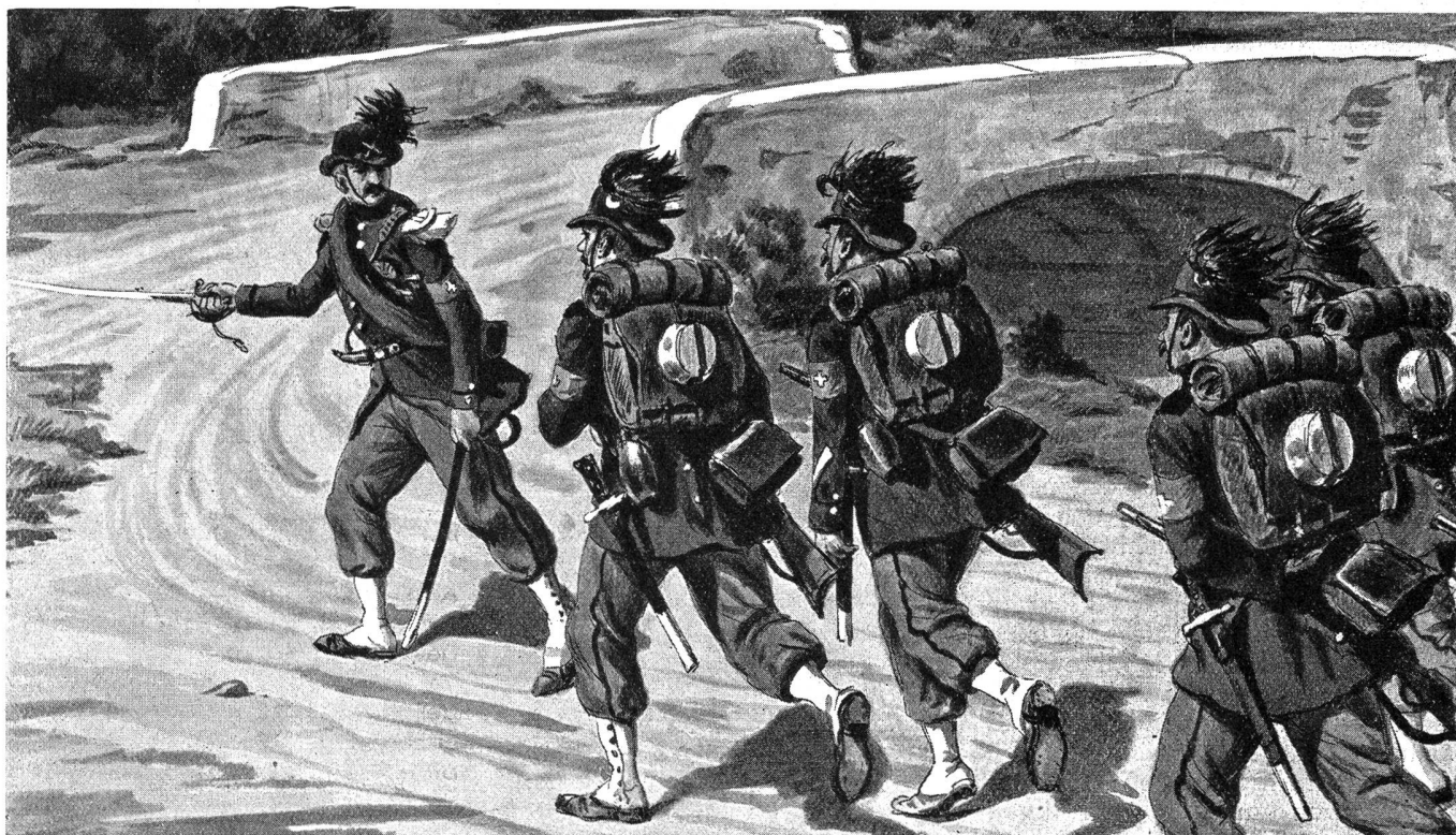
Bundestruppen : Scharfschützen

Gottfried Kellers «Fähnlein der sieben Aufrechten» ersichtlich ist, während sich andere Kantone mit sonntäglichen Drillübungen begnügten, so wie man heute noch für die freiwilligen Feuerwehren einige Rekrutenübungen durchführt. Unter solchen Verhältnissen war begreiflicherweise der Ausbildungsstand der kantonalen Kontingentstruppen sehr unterschiedlich. Von Bundes wegen suchte man diesem Uebelstand entgegenzuwirken durch mancherlei Kurse an der eidgenössischen Zentralschule in Thun, vorab durch Lehrkurse für kantonale Instruktoren, und durch Kurse für Offiziere und Unteroffiziere der Artillerie und des Genies. Seit 1820 wurden ferner eidgenössische Uebungslager durchgeführt, in die im Wechsel je einige Tausend Mann kantonaler Truppen einberufen wurden zur Schulung der Kommandanten und Stabsoffiziere. Diese Truppenzusammenzüge dauerten zunächst 8, später 21 Tage und haben viel dazu beigetragen, bei den kantonalen Truppen das Gefühl der schweizerischen Verbundenheit zu wecken und zu stärken. Sie boten Gelegenheit, die kantonalen Truppen zeitweise auf ihre Kriegstüchtigkeit hin zu prüfen und den Führern etwelche Gelegenheit zu geben, sich in der Führung der Truppen zu üben. In der Zeit von 1820 bis 1852 wurden 14 eidgenös-