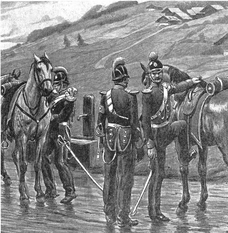
Bundesstruppen : Dragoner

das Kriegsmaterial, die Bewaffnung und die Instruktion, namentlich der Spezialwaffen, sorgfältig gegeben worden war.» Als schwache Seite nennt dann General Dufour die Instruktion im Sicherheitsdienst und das Bagagewesen. Für die Infanterie wünscht er eine Erleichterung der Ausrüstung. Im Sicherheits- und Wachtdienst hat die Infanterie im allgemeinen «eine Art von Gleichgültigkeit und Sorglosigkeit bemerken lassen». Mangelnde Marschordnung wird der Sorglosigkeit oder der Unfähigkeit der höheren Offiziere zugeschrieben. «Diese Unordnung, welche das größte Unheil erzeugen kann, muß ernstlich unterdrückt werden. Bei einem unordentlichen, lärmenden Marsche verschwindet alle Mannszucht; die Soldaten lassen sich leicht durch Uebelwollende zu bösen Handlungen verleiten, und die Erfahrung hat gezeigt, daß, wenn während des Feldzuges unangenehme Auftritte stattgefunden haben, dies hauptsächlich Bataillonen zugeschrieben werden mußte, welche auf dem Marsche nicht in Ordnung gehalten worden waren.» Die herrschende Verschleuderung von Patronen wird der ernststen Aufmerk-