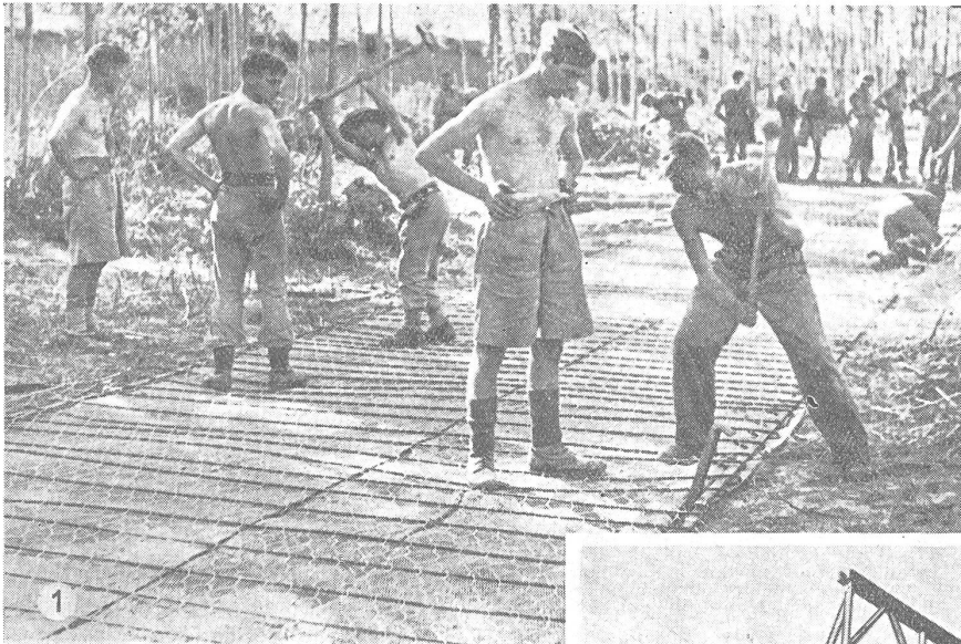
① Das Stahlnetz eines Sommerfeld-Pfades wird mit Stahlbolzen im Boden verankert. Da die Unterlage nicht gut trocken ist, mußte eine Kokosmatte zum Schutz gegen die Feuchtigkeit unterlegt werden. Sechzig Mann vermögen gegen 1200 Meter im Tag von dieser Stahlstraße zu verlegen.

Splintbolzen fest verankert. Zusammengefügt wird sie in Deckung und dann Stück für Stück über das Hindernis geschoben, bis ihre Nase am andern Ufer aufliegt. Viele der ersten Bailey-Brücken in Nordafrika dienen jetzt schon seit Jahren einem starken Verkehr. Bei der Abnahme von den Fabriken besteht jeder Einzelteil ja auch seine Probe: Sie werden prüfungshalber zu 18 Meter langen Brücken zusammengefügt und am andern Ende laufend wieder demontiert. — Sicher wird auch in der Friedenszeit die Nachfrage nach den handlichen Bailey-Brücken nicht erlöschen. KMW.