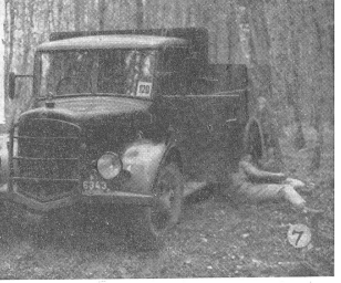
1 Immer wieder das Kartenlesen; es war bei dieser Prüfung, wo es auf so kleine Details ankam, besonders heikel. 2 Beobachtete Scheiben mußten nachträglich, also nach dem Gedächtnis, in der Karte eingezeichnet werden. 3 Das Studium des Befehls mußte mit größter Gründlichkeit und Gewissenhaftigkeit erfolgen, sonst rächte sich ein vermeintlicher Zeitgewinn in Form unerwarteter Strafpunkte bitter.