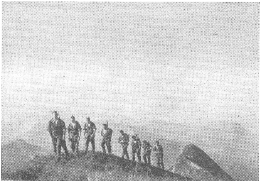
Auf den Spitzen und Kämmen der Heimat.

Langsam nur wich das Rot den ersten Schatten der einbrechenden Nacht, die mit dem schon freundlich blinkenden Abendstern ihren ersten Boten sandte. Mit der ersten Dämmerung wagten sich auch die Gamsen auf den Gipfel des Angstmatthorns, die gegen den