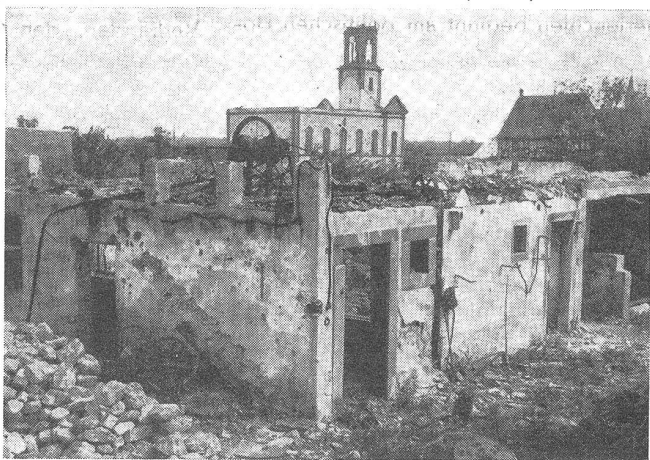
Was vom Zentrum der Ortschaft Ostheim (b. Colmar) übrigblieb.