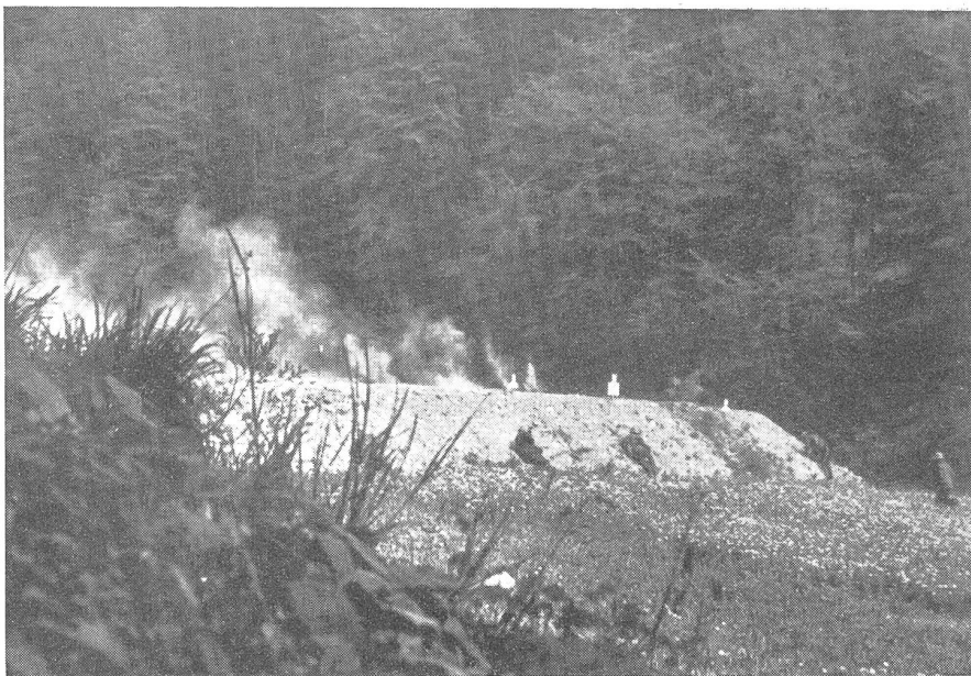
Ueberschießen von eigenen Truppen. 3. Phase: Der Stoßtrupp ist an der Geländeböschung angelangt, aber immer noch können ihm die Mg. wirksamsten Feuerschutz auf nächste Nähe geben.