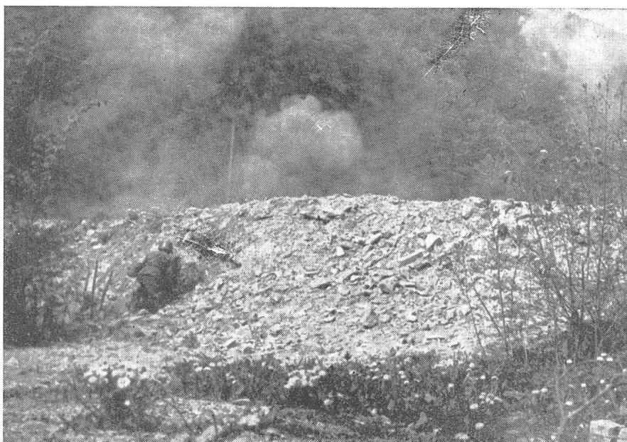
Ueberschießen eigener Truppen: Phase 4: Die Böschung gibt dem Stoßtrupp auch einwandfreie Deckung beim H.-G.-Wurf.

Das Orientierungsschießen mit den zwei Übungswurfgranaten hat bei jedem Zielwechsel zu erfolgen, also immer dann, wenn im Richtaufsatz neue Elemente eingeführt werden. Sinngemäß ist das entsprechende Einschießen von jedem Minenwerfer zu tätigen; es dürfen nicht von einem Geschütz erschossene Daten auf die übrigen übertragen und direkt Wirkungsschießen gefeuert werden. (Fortsetzung folgt)