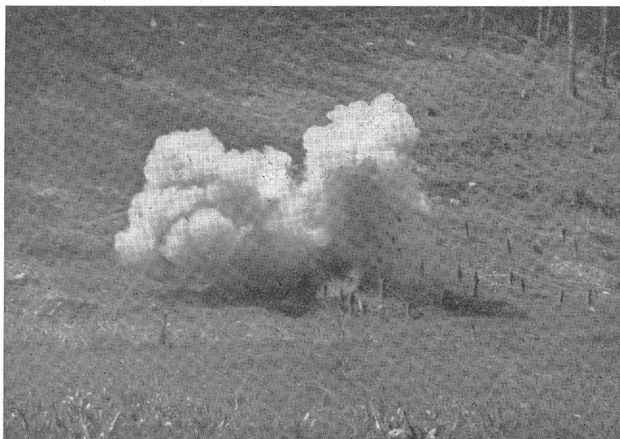
Die gestreckte Ladung geht hoch...

Das technische Reglement Nr. 8 schreibt vor, daß Uebungsplätze, auf denen scharfe H-G. geworfen werden, folgenden Anforderungen gerecht werden müssen: «Das Gelände im Um-