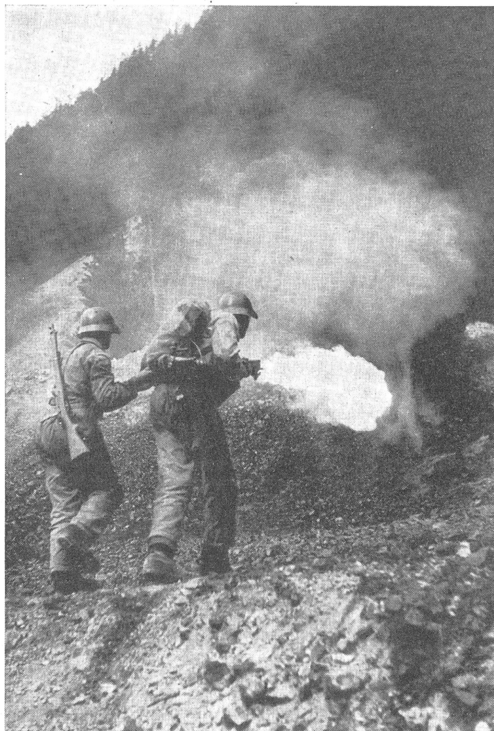
Flammtrupp im Angriff.

Bei allen Scharfschießübungen hat unmittelbar beim Schützen ein Mann