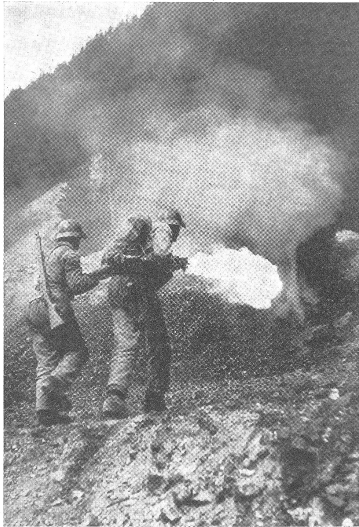
Flammtrupp im Angriff.

Bei allen Scharfschießübungen hat unmissbar beim Schützen ein Mann