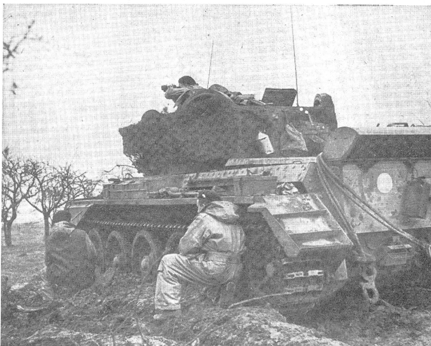
«Crusader»-Panzerkampfwagen als Beobachtungsposten. Man beachte die Ersatzlaufrollen, die rings um den Geschützturm befestigt sind.