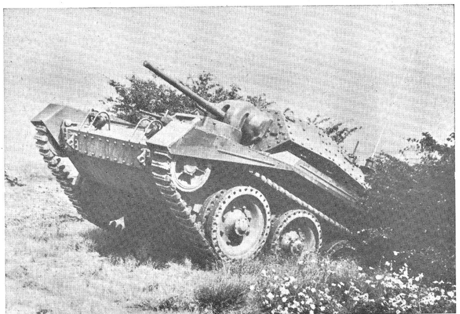
Der leichte Kreuzertank «Crusader».

Panzerkampfwagens sind im Verhältnis zu Größe und Gewicht stark bewaffnet. Ein Zweipfünder-Schnellfeuergeschütz (40 mm) und ein BESA-Maschinengewehr sind coaxial im Geschützturm montiert; hier ist ebenfalls ein 50,8-mm-Nebelwerfer angebracht. Eine Anzahl Tanks wurde mit einer 76,2-mm-Haubitze für Rauch- und Hochexplosivgranaten zur direkten Unterstützung der Infanterie ausgerüstet; diese Haubitze kann wahlweise anstatt des Zweipfündergeschützes aufmontiert werden und ist mit diesem auswechselbar. Der Geschützturm ist hydraulisch angetrieben, um 360° drehbar, und durch seine Vieleckform (polygonal) leicht erkennbar. Im Bug neben dem Fahrer ist ein Befehlsturmchen mit einem BESA-Maschi-