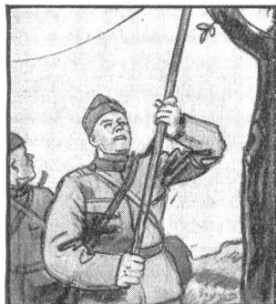
„I alle Regimänte, bi jeder Kompanie, müend dere Sapermente zum telefonle si.“

Die preußische Provinz Schlesien, die 476 000 Quadratkilometer umfaßt und in der 7 460 000 Menschen leben, ist zum Kriegsschauplatz geworden. In dieser Provinz, vor allem in ihren östlichen Teilen, liegen reiche Schätze an Kohlen und Eisenerzen im Boden. Aufbauend auf diesen Naturgütern ist da schon früh eine ausgedehnte Eisen- und Kohlenindustrie entstanden, die an Wichtigkeit derjenigen des Ruhrgebietes nahekommt. Die Bedeutung Schlesiens als Rüstungsarsenal Deutschlands ist gerade in der letzten Zeit gewaltig angestiegen. Da die Industrien des Rhein-