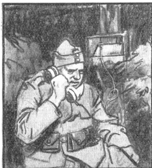
„Dü Poschte isch gar wichtig, wenn's de is Trüffe goht. Dass me's Kommando richtig züh Schtunde wit versteht.“