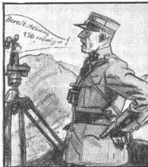
Aber eine klare, starke Stimme gehört immer dazu, beim Telefonieren wie beim Kommandieren.