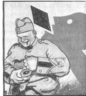
Deshalb gehören Gaba in jedes Soldatenpäckli. Gaba schicken — Gaba schützt.