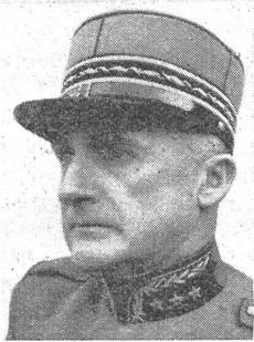
Oberstbrigadier Julius Schwarz , bisher Kommandant einer Gebirgsbrigade, ehemaliger Kdt. der Festung St. Maurice, nimmt seinen Rücktritt. (VI BU 16969)