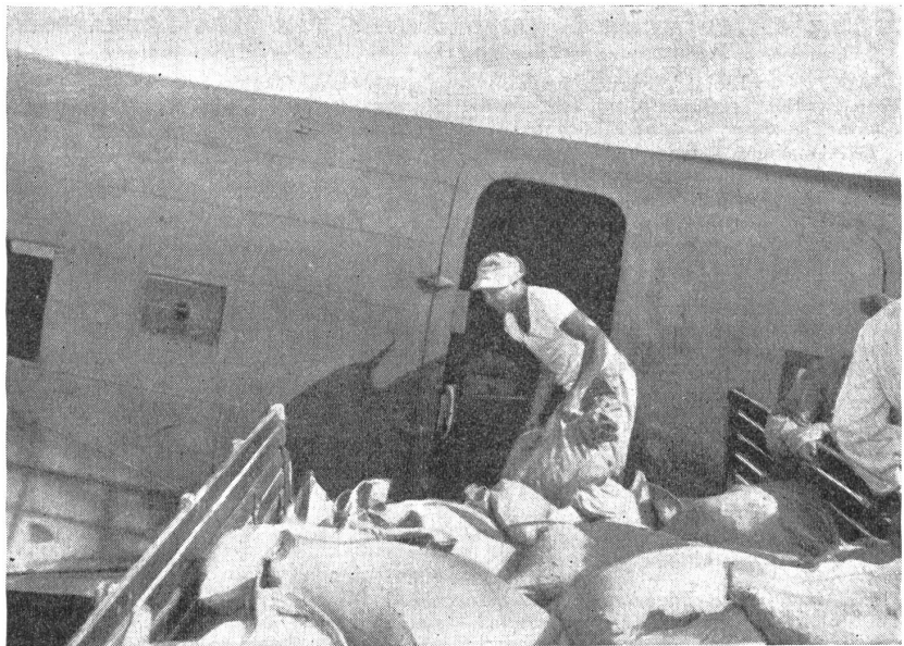
Lebensmittelsäcke werden in England an Bord des Flugzeuges gebracht.

Es war üblich, die Behälter während hellen Mondnächten abzuwerfen, doch beim Herannahen des Invasionstages nahmen auch die Bedürfnisse des Maquis zu. Neue Taktiken mußten gesucht werden, um Material und Waffen zu jedem Preis in erhöhtem Maße nach Frankreich zu transportieren — trotz der Gestapo, die langsam Verdacht schöpfte und mehr denn je aktiv war. In dunklen Nächten wurde die Mission weiter durchgeführt, welche von den Piloten ein erneutes Training und äußerste Konzentration erforderte. In abgelegenen Gegenden Großbritanniens wurde Nacht für Nacht geübt, bis auch diese Schwierigkeit überwunden war und eine reibungslose Zusammenarbeit zwischen Pilot und Empfangskomitee sicherstellte. Die Flieger mußten in kürzester Frist die Abwurfstellen rekonoszieren und mit äußerster Präzision ihre Behälter auf kleinstem Raum abwerfen. In Gegenden, wo mit dem Auftauchen des Feindes innert Minutenfrist gerechnet werden mußte, wurde Schnelligkeit zum wichtigsten Faktor. Es entstand ein gefährliches Geschicklichkeitsspiel zwi-