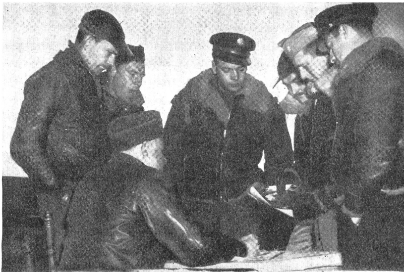
Orientierung vor dem Abflug. Piloten des «Untergrund-Luftdienstes» erhalten die letzten Instruktionen.

Seit Beginn der Arbeit im Januar 1941 bis zum 6. Juni 1944 wurden insgesamt 30 000 Behälter allein über Europa abgeworfen, und je näher der D-Tag heranrückte, desto größeren Umfang nahmen die Abwürfe an. So wurden allein in den Monaten März, April und Mai d. J. 10 000 Behälter abgeliefert. Zehntausende von Gewehren, von Antitankgeschützen, Handgranaten, Pistolen, Maschinengewehren und andern leichten Waffen kamen auf diese Weise