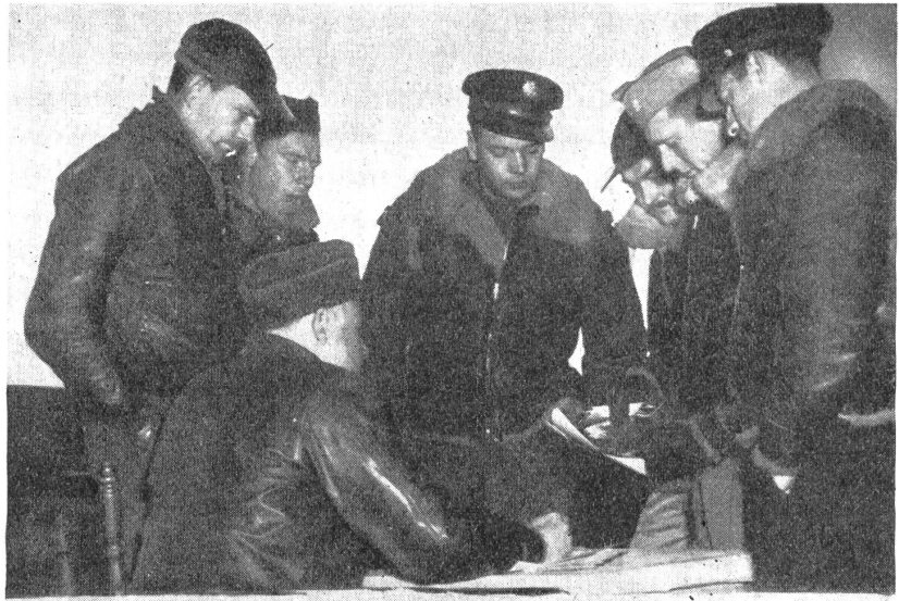
Orientierung vor dem Abflug. Piloten des «Untergrund-Luftdienstes» erhalten die letzten Instruktionen.

Seit Beginn der Arbeit im Januar 1941 bis zum 6. Juni 1944 wurden insgesamt 30 000 Behälter allein über Europa abgeworfen, und je näher der D-Tag heranrückte, desto größeren Umfang nahmen die Abwürfe an. So wurden allein in den Monaten März, April und Mai d. J. 10 000 Behälter abgeliefert. Zehntausende von Gewehren, von Antitankgeschützen, Handgranaten, Pistolen, Maschinengewehren und andern leichten Waffen kamen auf diese Weise