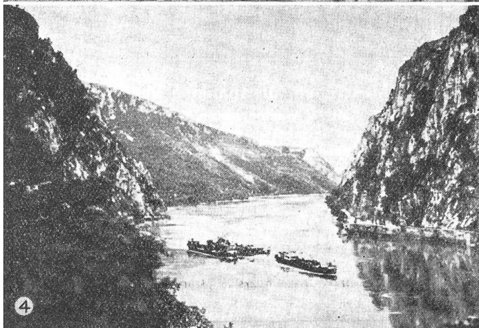
④ Der Donaudurchbruch am «Eisernen Tor» zwischen Orsova und Turnu Severin.