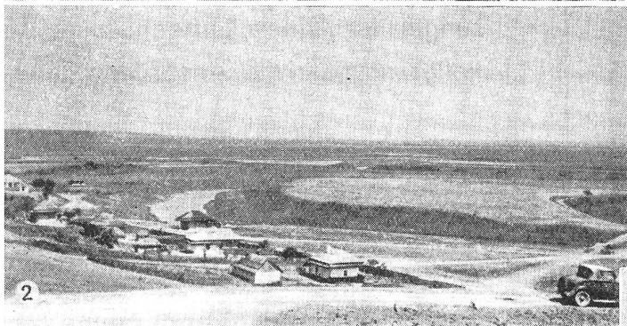
② Typische Landschaft am untern Pruth, der sich in vielen Mäandern durch das Flachland windet.