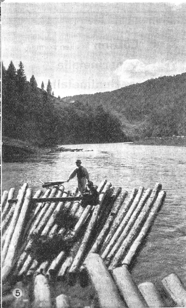
⑤ Die Bistritza, ein typischer Karpatenfluß.