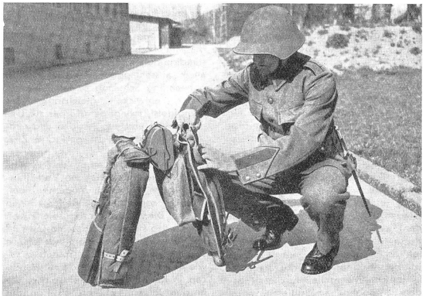
Der neue zweiteilige Tornister. Nach längeren Versuchen ist nun zwecks Möglichkeit zur Reduzierung des Gepäcks der Infanterie der neue Felltornister, Modell 1942, zur Ordonnanz erklärt worden. Es handelt sich um einen zweiteiligen Tornister , dessen Deckel abnehmbar ist. Unser Bild hier zeigt die beiden Teile, links den Tornisterkasten, der alle irgendwie entbehrlichen Gegenstände des Wehrmannes enthält und auf den Kaputt und Zelteinheit aufgeschnallt sind. Rechts der Deckel mit Brotsack und Gamelle, die sog. Marschpackung. Photopref (VI S. 15295).

(MAE.) Wer kennt ihn nicht, den im wahrsten Sinne des Wortes so anhänglichen Tornister des Soldaten. Wer hat ihn nicht in den oft stundenlangen Märschen ins Pfefferland gewünscht? Als dann einige ganz Schlaue die allzu schmalen Tragriemen mit praktischen Filzbelagen versehen und dadurch bedeutend leichter marschieren konnten, wurde diesen erklärt, das sei nicht ordonnanzmäßig und so rasch die Helfer des so sehr Beladenen auftauchten, so plötzlich mußten sie verschwinden. Nun will man den Tornister weniger «anhänglich» machen. Seit geraumer Zeit suchte man in Bern nach Mitteln und Wegen, das Gepäck der Infanterie zu erleichtern. Wie nun der Bundesrat in seinem Geschäftsbericht über das Militärdepartement bekanntgibt, ist es einem findigen Kopf gelungen, einen zweiteiligen Tornister zu konstruieren, der diesen Anforderungen in hohem Maße gerecht zu werden verspricht. Dank der praktischen Beschaffung ermöglicht der neue Tornister namentlich dem Infanteristen in einem Teil nur die