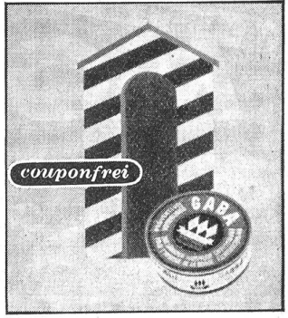
Gaba nehmen — Gaba nützt, Gaba schicken — Gaba schützt.