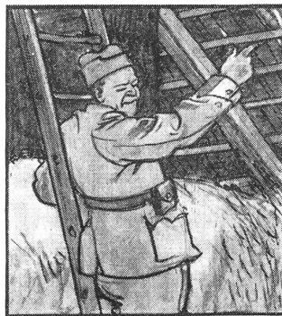
„Da hat's ja Löcher im Dach! Hat keiner ein paar Schindeln im Sack?“