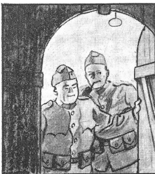
's wär schon recht, das Kantonnement, Platz genug und frisches Stroh, — aber zülig ist es.

Die rund 100 000 Ortswehrsoldaten fühlen sich mitverantwortlich für die Landesverteidigung und verdienen Anerkennung durch Volk und Armee. S.