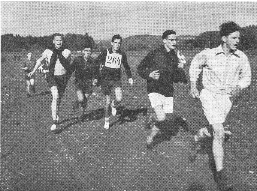
Zäh und verbissen wird um die Siegerehre gerungen. (VI 13908.)

Mädchengruppen — Kameradinnen aus dem FHD. oder die jungen, unternehmungslustigen Pfadi von Küsnacht — sich begeistert mit ihren Kameraden messen.