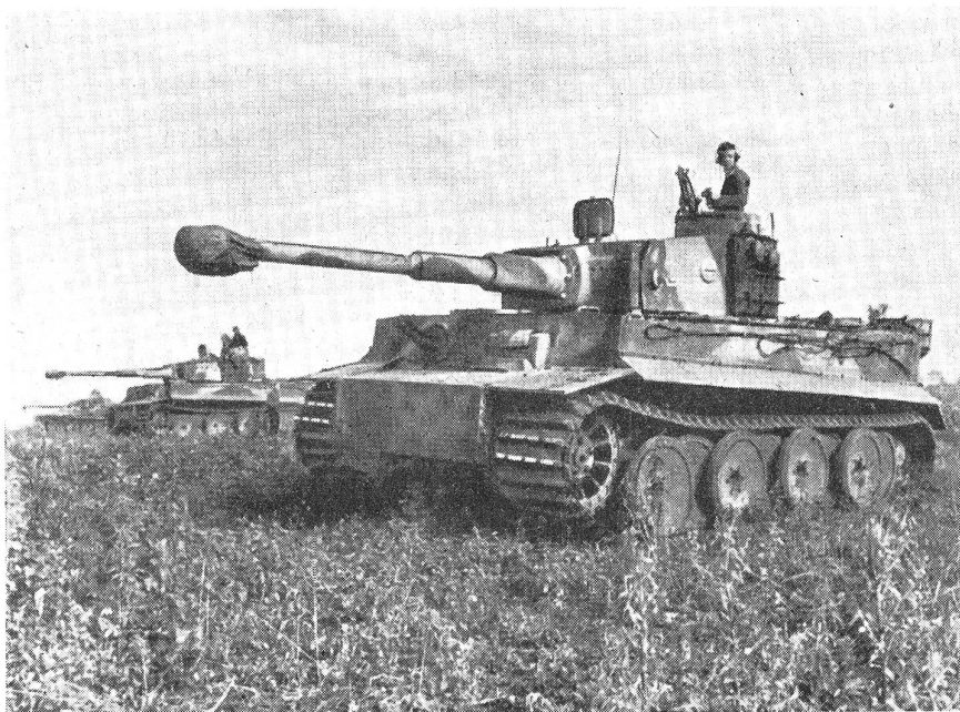
Moderner Panzerkampfwagen aus dem Jahre 1943 (Typ «Tiger»).

Die ersten Tanks trugen die Namen «Centipede» (Hundertfüßler), «Mother» (Mutter), «Big Willie» und «Mark I». Ihre nun in der ganzen Welt übliche Bezeichnung verdankt sie einem originellen Umstand. Bei den Einsatzvorbereitungen der stählernen und feuerspeienden Ungeheuer suchten die Franzosen zur Irreführung der Deutschen die Panzerfahrzeuge als Wassertanks zu tarnen. Die Attrappen bestanden aus Leinwand, trugen Aufschriften über Herkunft und Rauminhalt der Wassertanks usw. In der Folge taufte die Soldaten die Panzer einfach «Tank». Sprechen wir heute von den Tanks, dann denken wir allerdings nicht mehr an Wasser, sondern vielmehr an Blut. chb.