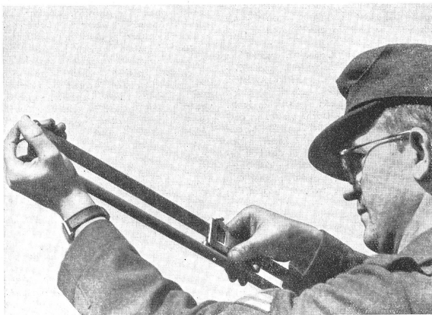
Mit einer Spezial-Schublehre wird der Abstand zwischen den beiden Kerben auf dem größern Fallgewicht gemessen: eine einfache Formel ergibt dann die Anfangsgeschwindigkeit des Geschosses.

schoß das Rohr verläßt. Ist diese bekannt, so können die Granaten richtig «tempiert» werden. Der V-Null-Trupp führt zu seinen Untersuchungen auf einem Auto mit Anhänger wissenschaftliche Meßinstrumente mit sich, denn die Anfangsgeschwindigkeit ist bei modernen Geschützen enorm hoch. Die Messungen erfolgen mit dem von einem Franzosen erfundenen Boulanger-Apparat auf magnetelektrischem Wege. Die Granate wird magnetisiert und passiert anfangs ihrer Flugbahn zwei Spulen; der Moment des Vorbeifluges erzeugt einen Stromstoß. Die erste Spule löst ein größeres Fallgewicht aus, die zweite ein kleineres, das in das erste Gewicht durch ein Schlagmesser eine Kerbe schlägt. Die Messung mit einer Lehre ergibt den neuen V-Null-Wert, der für die weiteren ballistischen Berechnungen ausschlaggebend ist.