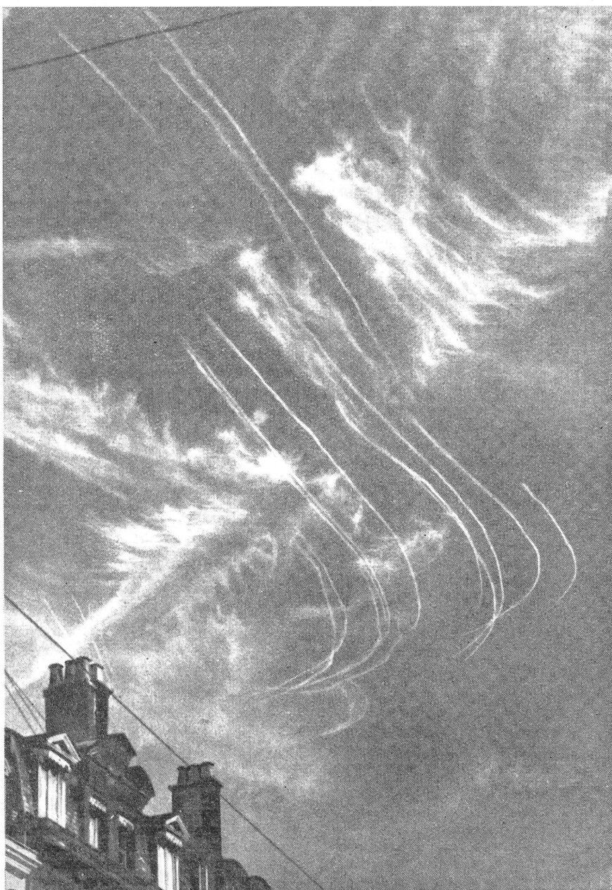
Selbst zwischen echten Wolkenformationen sind die Kondensstreifen deutlich erkennbar.

Den Anlaß zu diesen Wolkenstreifenbildungen geben die heißen Auspuffgase der Flugmotoren, die mit Wasserdampf gesättigt sind. Der im Auspuff vorhandene Wasserdampf wird durch Kondensation oder Sublimation in Form von Nebelstreifen oder Wolken aus feinsten Eiskristallen sichtbar. Ist nun bei entsprechenden Temperaturen in der Atmosphäre und bei einem bestimmten Feuchtigkeitsgehalt der Luft eine gewisse Bereitschaft zur Wolkenbildung vorhanden, so dehnen sich die Kondensstreifen aus und bilden später eine Wolke, deren Ursprung nicht mehr erkennbar ist und die völlig einer meteorologischen Wolke gleicht. Im allgemeinen verschwindet das Kondensat bald wieder, weil die Luft vom Flugzeug abwärts beschleunigt wird, was einer Wolkenbildung