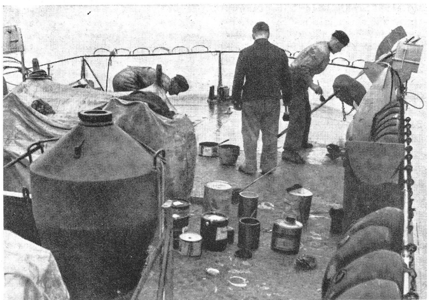
Ein U-Boot erhält einen neuen Tarnanstrich.

Diesmal griff man, wenn der Ausdruck erlaubt ist, in den richtigen Farbtopf. Man bemalte die Schiffe in grellen Farben von größter Gegensätzlichkeit und spekulierte dabei mit einem physiologischen Fehler des Auges, das sich nicht gleichzeitig auf mehrere stark voneinander abweichende Farben konzentrieren kann und höchstens eine davon deutlich erkennt. Durch den schroffen Gegensatz von schwarz, weiß und blau und durch ein sorgfältig und wissenschaftlich ausgeklügeltes System von Punkten und Strichen zerstörte man die Ausgeglichenheit der Linien, schuf man sogenannte falsche Anhaltspunkte. Die Bemalung des Schiffskörpers ergänzte man, vor allem bei den Handelsschiffen, durch eine geschickte Camouflage der Aufbauten, der Kamine, Masten, Brücken, Rettungsboote und so weiter. Mit Hilfe von Stoffattrappen fälschte man Profile, zum Beispiel von Kaminen, Türmen