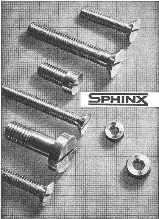
SPHINXWERKE MÜLLER & CO A.G. SOLOTHURN Schraubenfabrik und Fassondreherei