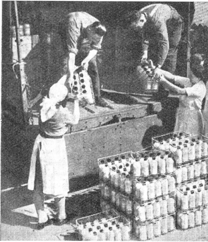
Verlad konservierten Blutes für die englische 8. Armee.

daß die Erfolge operativer Behandlung um so besser waren, je früher die Wundversorgung stattfand. Er schuf als Folge seiner Erkenntnis die «fliegenden Ambulanzen», um schon auf dem Schlachtfeld innerhalb von vierundzwanzig Stunden die Verwundeten behandeln und dann abtransportieren zu können. Larrey war selbst ein glänzender Chirurg und hat bei Borodino innerhalb eines Tages zweihundert Amputationen selbst vorgenommen.