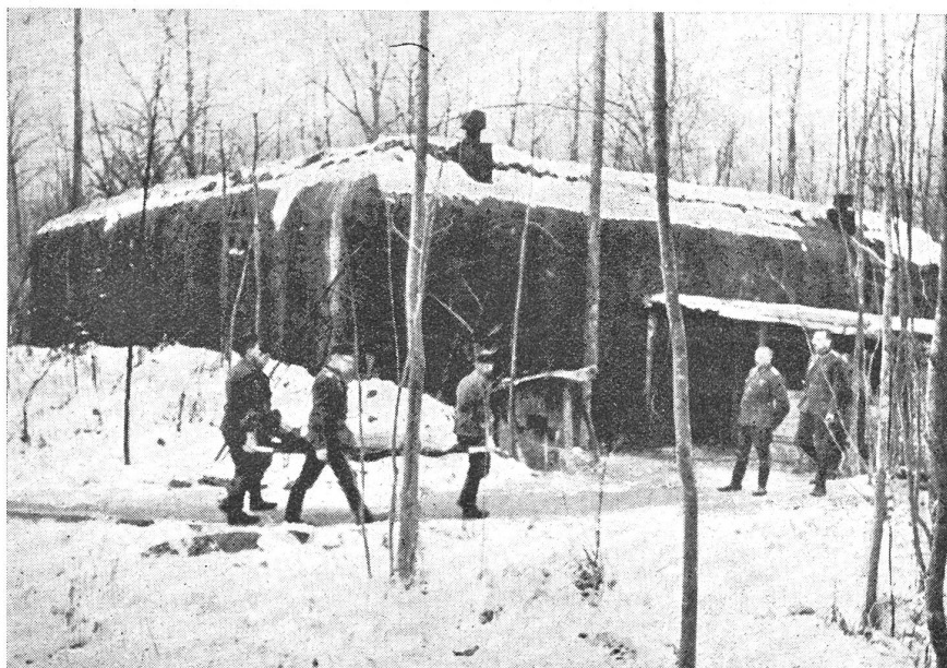
Antransport eines Verwundeten in einen Sanitätsbunker des deutschen Westwalls.

Gestützt auf diese und andere Beobachtungen setzte in den darauf folgenden Jahren ein großer Gelehrtenstreit ein, der aber unentschieden ausging: keine der Ansichten, die zur Debatte standen, mußte die Segel streichen, denn es wurden Verbesserungen auf einer andern Ebene erzielt: der erste Wundarzt Napoleons in zwei Feldzügen, Larrey , entdeckte den Faktor Zeit in der Wundversorgung. Er stellte fest,