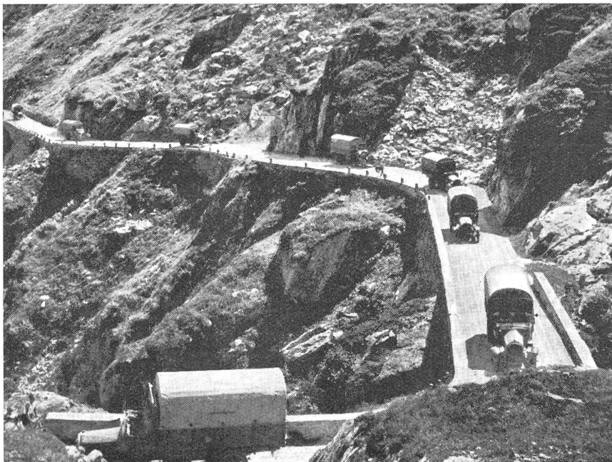
Motortransport-Kolonnie in Fahrt auf einer Alpenstraße. (Zens.-Nr. VI S 12731.)

So kommt es vor, daß die Motorfahrer in gewissen Einheiten den Gewehrgriff und das Gewehr-Schultern üben müssen, mit der Begründung, sie hätten ja doch nichts zu tun und es