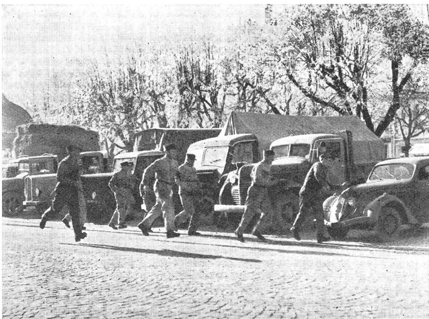
Im Laufschrift geht es an die Motorfahrzeuge. (Zens.-Nr. N/V/8232.)

Durch die Ausrüstung aller Motorfahrer mit dem Karabiner ist eine einheitliche Ausbildung möglich geworden. Der eifrige Kolonnenkommandant und mit ihm seine Zugführer, fin-