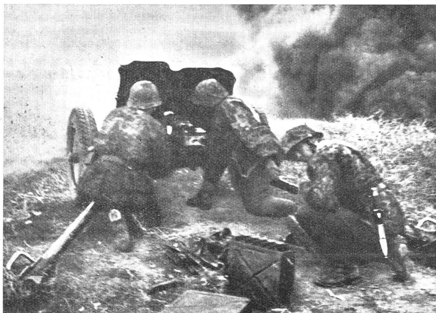
Abwehr eines feindlichen Panzer-Gegenstoßes.

derstand des Feindes mit Hilfe der eigenen Waffen niederzukämpfen. Als Schußwaffen stehen ihr dazu das Gewehr und das leichte Mg., die Pistole und die Maschinenpistole zur Verfügung. Als Stoß- und Hiebwaaffe dienen ihr das aufgepflanzte Seitengewehr, der Gewehrkolben, der Spaten. Die Handgranate und die geballte Ladung werden ihr im Stellungs- und Bunkerkampf von Nutzen sein. Pionierstoßtrupps werden mit den Stoßtrupps dabei Hand in Hand arbeiten. Wenn auch die Weisheit jenes zaristischen Generals überlebt ist, der seinen Grenadiern zurief: «Die Kugel ist eine Törm, das Bajonett aber ein ganzer Mann!», wenn auch der treffsichere Nahschuß ebenbürtig neben dem Hieb und Stoß der blanken