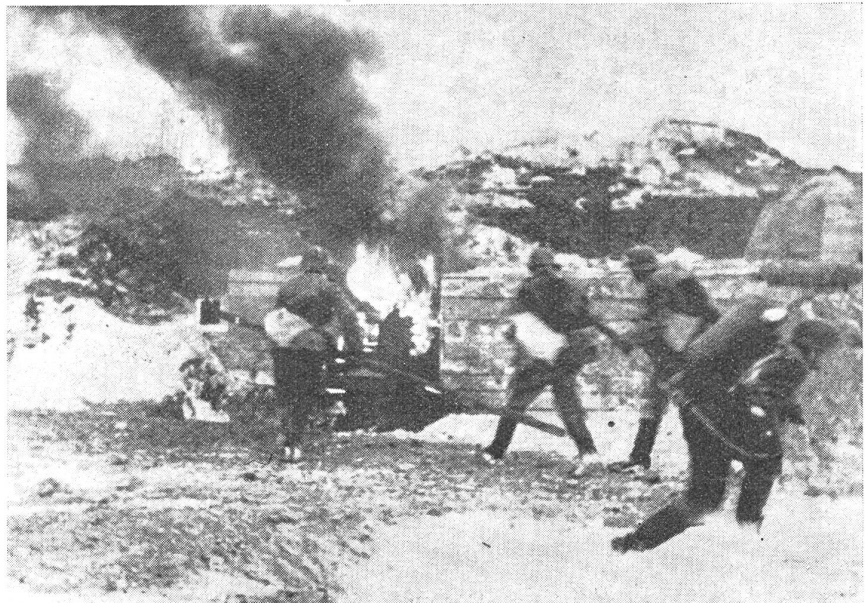
Der Pionier-Stoßtrupp beseitigt den letzten Widerstand des Feindes.

lichen Granaten als Tarnmantel ausnutzen. Sie werden auch nicht einheitlich auf breiter Front in des Feindes Stellung einbrechen können, sondern werden irgendwo und irgendwie sich weiche Stellen in ihrem Damm zeigen, in sie einsickern und ihn einer Sturmflut gleich unterwühlen und auseinanderreißen. Darunter aber dürften der Schwung des Gesamtangriffes, das Zupacken des einzelnen Stoßtrupps, nicht leiden. Die deutsche Ausbildungsvorschrift für die Infanterie sagt hierüber: «Der Schützentrupp arbeitet sich auf Einbruchentfernung, d. h. so nahe an den Gegner heran, wie es ohne Gefährdung durch das auf der Einbruchsstelle liegende Feuer möglich ist. Dann wird in der Regel unter Führung des Gruppenführers mit aufgepflanztem