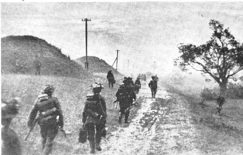
Infanterie im Vormarsch in Gefechtsgliederung.