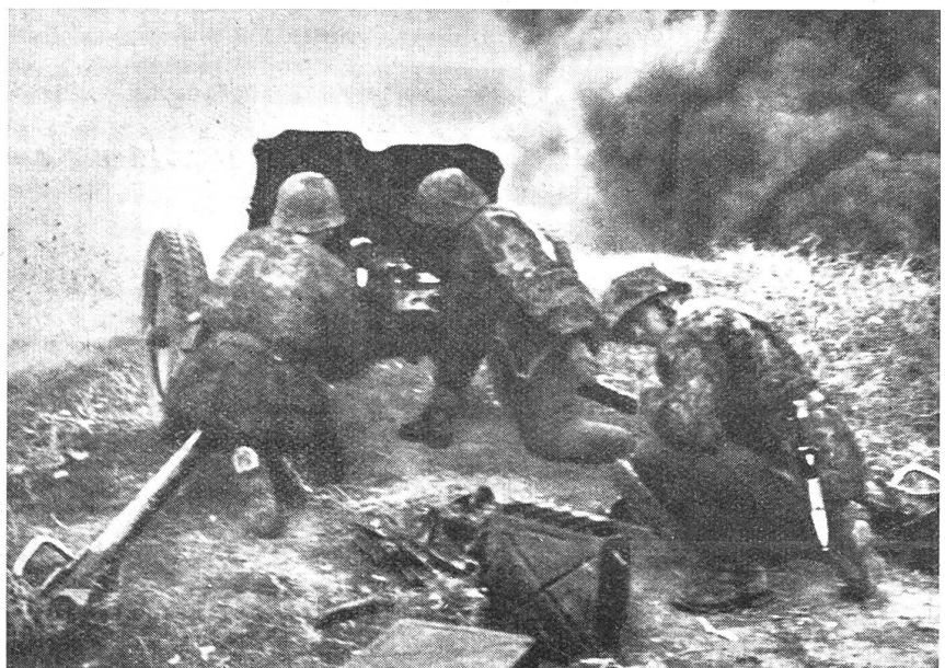
Abwehr eines feindlichen Panzer-Gegenstoßes.

derstand des Feindes mit Hilfe der eigenen Waffen niederzukämpfen. Als Schußwaffen stehen ihr dazu das Gewehr und das leichte Mg., die Pistole und die Maschinenpistole zur Verfügung. Als Stoß- und Hiebwaaffe dienen ihr das aufgepflanzte Seitengewehr, der Gewehrkolben, der Spaten. Die Handgranate und die geballte Ladung werden ihr im Stellungs- und Bunkerkampf von Nutzen sein. Pionierstoßtrupps werden mit den Stoßtrupps dabei Hand in Hand arbeiten. Wenn auch die Weisheit jenes zaristischen Generals überlebt ist, der seinen Grenadiern zurief: «Die Kugel ist eine Törm, das Bajonett aber ein ganzer Mann!», wenn auch der treffsichere Nahschuß ebenbürtig neben dem Hieb und Stoß der blanken