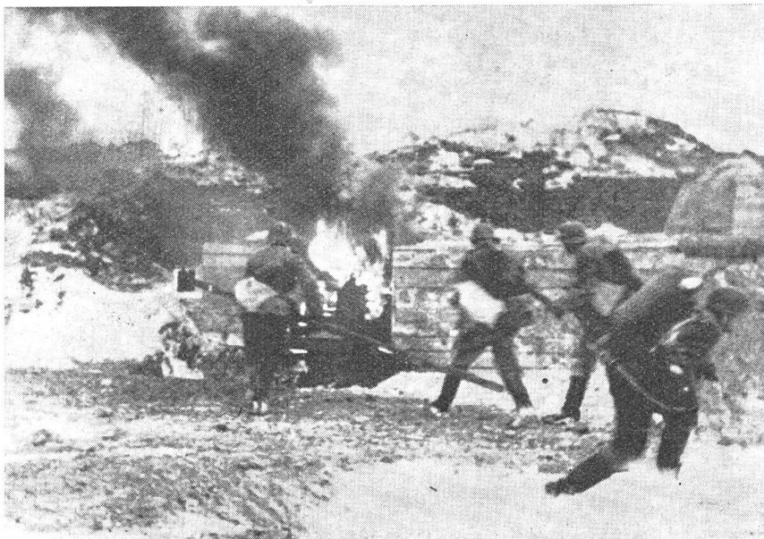
Der Pionier-Stoßtrupp beseitigt den letzten Widerstand des Feindes.

Die Stürmer werden sich dabei alle Hilfsmittel neuzeitlicher Technik zunutze machen. Sie wissen, daß sie von den rückwärtigen schweren Maschinenwaffen gerade auf der Höhe der Krise keine Unterstützung zu erwarten haben, da jene, wenn sie das Feuer bis zu dem Augenblick fortsetzen, an dem die beiden Linien sich ineinander zu verkrampfen drohen, Gefahr laufen, durch Kurzschüsse die eigenen Stürmer zu treffen. Die Infanterie hat sich daher eigene Maschinenwaffen (leichtes und schweres Mg., leichte und schwere Granatwerfer, Infanterie- und Panzerabwehrgeschütze) organisch angegliedert, die tragbar, leicht beweglich im Mannschaftszug oder auf geländegängigen Kraftfahrzeugen die Stoßtrupps begleiten und ihnen Feuerschutz ge-