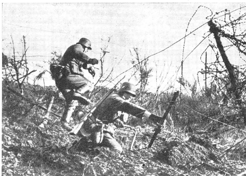
Am feindlichen Drahtverhau.

Der Infanterist des gegenwärtigen Krieges weiß beides, Kraft und Schwung, zu vereinen. Er versteht es, sie den Formen anzupassen, die der Infanteriesturm unter den Einwirkungen neuzeitlicher Maschinenwaffen annehmen muß. Im Massengefeuer der Geschütze, Maschinengewehre und Granatwerfer muß das Gefüge der Sturmkolonnen und Schützenlinien sich in einzelne Stoßtrupps auflösen. Diese Stoßtrupps können sich nicht blindlings, im atemberaubenden Lauf über die deckungslose Ebene hinweg auf des Feindes Wehrstellung stürzen, selbst wenn Batterien von weit größerer Feuerwucht als im ersten Weltkriege ihnen Schutz gewähren würden. Sie müssen sich unter Ausnutzung feuerarmer Räume und Zeiten von Deckung zu Deckung an sie heranpirschen, müssen das eigene Gewand, den Anstrich ihrer Waffen, Geräte und Fahrzeuge, der Umgebung und den Jahreszeiten anpassen, das Dunkel der Nacht, die Früh- und Spätnebel des Tages, die Schleier der Nebelabteilungen, die Einschläge der eigenen und der feind-