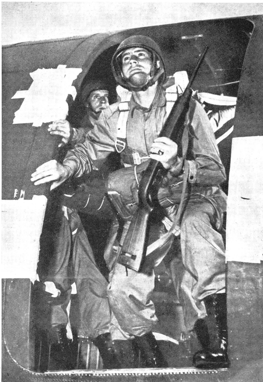
Bereit zum Sprung ins Leere.

Hat z. B. die Maschine, von der aus der Absprung erfolgt, eine große Geschwindigkeit, so ist es wichtig und wertvoll, den Fallschirm nicht zu früh zu öffnen, da sonst der Fallschirmspringer — der beim Hinausspringen dieselbe Geschwindigkeit wie die Ma-