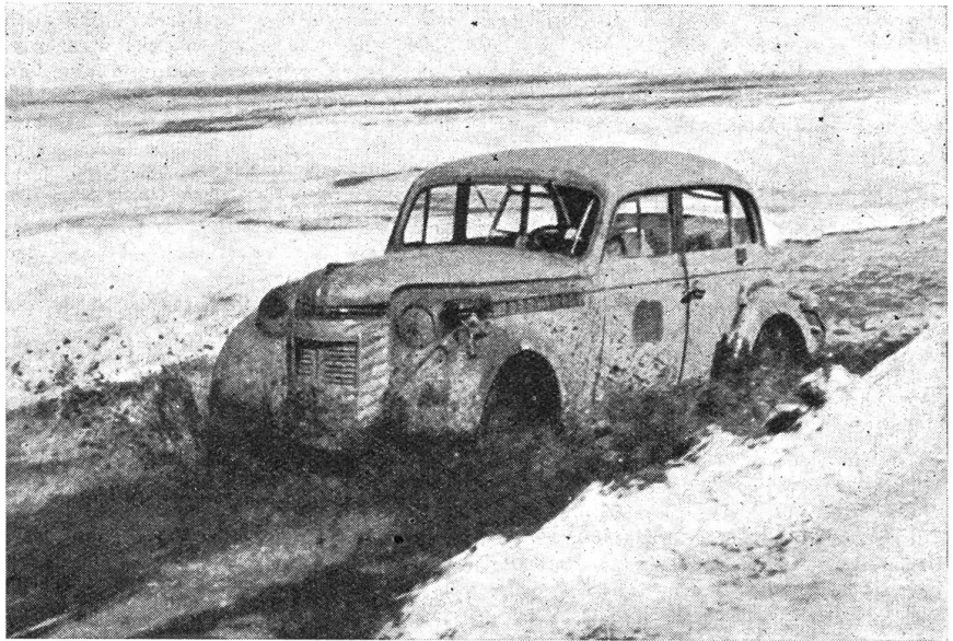
Tauwetter im Osten — fußhoch steht das Wasser auf den Straßen.

Nicht viel besser hat es der Lastwagenfahrer. Er muß seine ganze Fahrkunst anwenden, nur damit er nicht stecken bleibt und die «Straße» verstopft. Mit viel Geschick und Geistesgegenwart schaukelt er seinen Lastwagen durch den Lehmbrei, das Steuerad fest in seinen Händen. Er muß täglich (oder sollte!) bis 500 Kilometer zurücklegen. Bis tief in die Nacht fährt er unaufhaltsam im Lehmbad weiter, pflichtbewußt und unermüdlich in der Erfüllung seines Auftrages. Er weiß, wenn er ausfällt, daß seine Kameraden an der Front in Gefahr kommen können, daß die Munition oder die Verpflegung nach vorn müssen! Die Motorfahrer auf den russischen Straßen wissen nach einer Fahrt, was sie geleistet haben; Handgelenk, Kopf und Rücken tun weh, sind steif geworden von der Anstrengung. Kaum ist die Fahrt beendet, geht es von neuem los, unermüdlich jeden Tag. Fahrer und Hilfsfahrer lösen sich ab. Der Hilfsfahrer hat sich daran gewöhnt, auf dem schüttelnden Wagen seinen Schlaf zu finden, er weiß, sein Kamerad schafft es schon. Oft kommt es aber vor, daß beide zwei oder drei Tage oder mehr, kein Auge zudrücken können. Fahren, fahren und nochmals fahren für die Kameraden an der Front. —