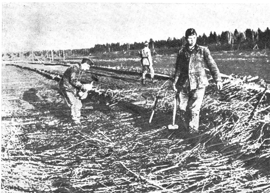
Nur der Knüppeldamm, der Meter um Meter aus gefällten Bäumen und Aesten erstellt werden muß, vermag den Nachschub an die Kampffront zu sichern.