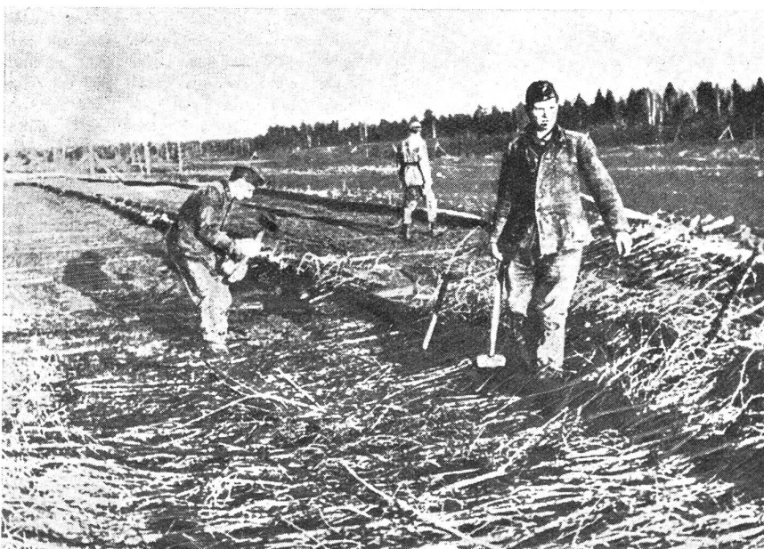
Nur der Knüppeldamm, der Meter um Meter aus gefällten Bäumen und Ästen erstellt werden muß, vermag den Nachschub an die Kampffront zu sichern.