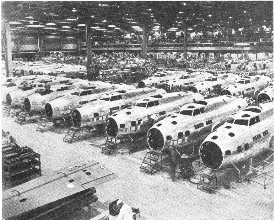
Zeugen der gewaltigen Luftausrüstung der USA: Fliegende Festungen werden am laufenden Bande hergestellt.

Die Schulungsmaschinen sind hier «Vultee-Eindecker» und doppelt so schwer wie die PT's. Die mit 450pferdigen Motoren versehenen Maschinen besitzen eine Stundengeschwindigkeit von über 150 Meilen, und sie sind mit allen Schikanen, wie: dem Radiosender und -empfänger, kontrollierbaren und verstellbaren Propellern und weiteren zwanzig Instrumenten — versehen. Hier beginnen auch die Uebungen auf den «Link-Trainern» — jenem am Boden festgemachten, sinnreichen Apparat, der auf alle Manipulationen des Piloten