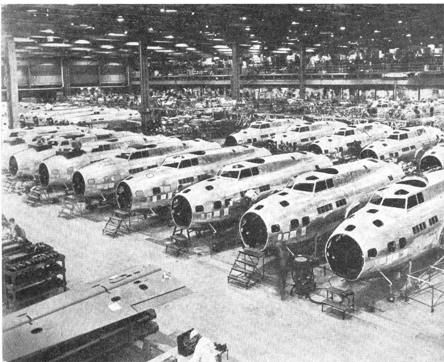
Zeugen der gewaltigen Luftausrüstung der USA: Fliegende Festungen werden am laufenden Bande hergestellt.

Die Schulungsmaschinen sind hier «Vultee-Eindecker» und doppelt so schwer wie die PT's. Die mit 450pferdigen Motoren versehenen Maschinen besitzen eine Stundengeschwindigkeit von über 150 Meilen, und sie sind mit allen Schikanen, wie: dem Radiosender und -empfänger, kontrollierbaren und verstellbaren Propellern und weiteren zwanzig Instrumenten — versehen. Hier beginnen auch die Uebungen auf den «Link-Trainern» — jenem am Boden festgemachten, sinnreichen Apparat, der auf alle Manipulationen des Piloten