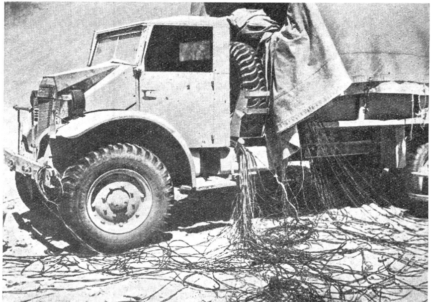
Die mobile «Nervenzentrale». Irgendwo auf dem Kriegsschauplatz in der ägyptischen Wüste ist die Telephonzentrale eines hohen englischen Kommandostabes auf einem gewöhnlichen Motorlastwagen installiert, wodurch eine rasche Dislozierung der für die Kampfführung so wichtigen Apparaturen gewährleistet ist.

Als die ersten britischen Truppen in Tripolis einzogen, näherte sich der Küste entlang dem Hafen eine Anzahl von Schiffen und Landungsbarken, deren Aufgabe es war, so rasch wie möglich den Hafen zu sichern und einen Zugang von der See her freizumachen. Darüber äußerte sich ein Berichterstatter der B.B.C. aus Kairo wie folgt: «Jedesmal, wenn die Achte Armee einen Hafenort besetzte, war die Flotte bereit, den Hafen zu übernehmen. Ehe noch am 23. Oktober der Angriff gegen El Alamein ausgelöst wurde, waren schon sämtliche Landungsdetachements der Flotte für alle Häfen bis nach Bardia aufgestellt und einsatzbereit. Die Landungstruppe für Tripolis machte sich auf den Weg, als Rommels Front bei El Agheila wich. Wie bei Bardia, Tobruk und Benghazi, so war die Flotte auch bei Tripolis vorbereitet, um die «durstigen» Tanks mit dem benötigten Brennstoff zu versorgen, bevor diese noch recht den Hafen erreicht hatten.» Es wird geschätzt, daß der Transport zur See mindestens zehnmal billiger