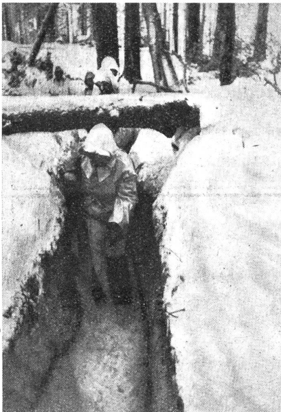
Der Stoßtrupp geht durch die eigenen Laufgräben vor ...

den Boden gedrückt. Hat die aufzischende Patrone ihre höchste Höhe und ihre stärkste Leuchtkraft erreicht, dann streicht das Licht über eine Fläche, in der kein Leben zu sein scheint.