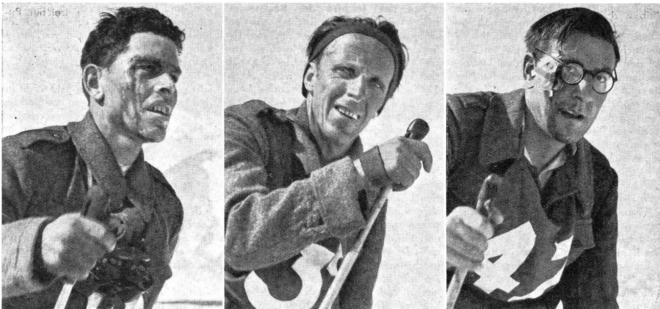
Drei von Dreizehnhundert. Schnappschüsse aus dem Patrouillenlauf. Verbissen werden die letzten Streckenkilometer in Angriff genommen. Was tut's, wenn man aus einer Wunde blutet? Die Aufgabe soll erfüllt werden! (Zensur-Nr. VI S 12204/6.)