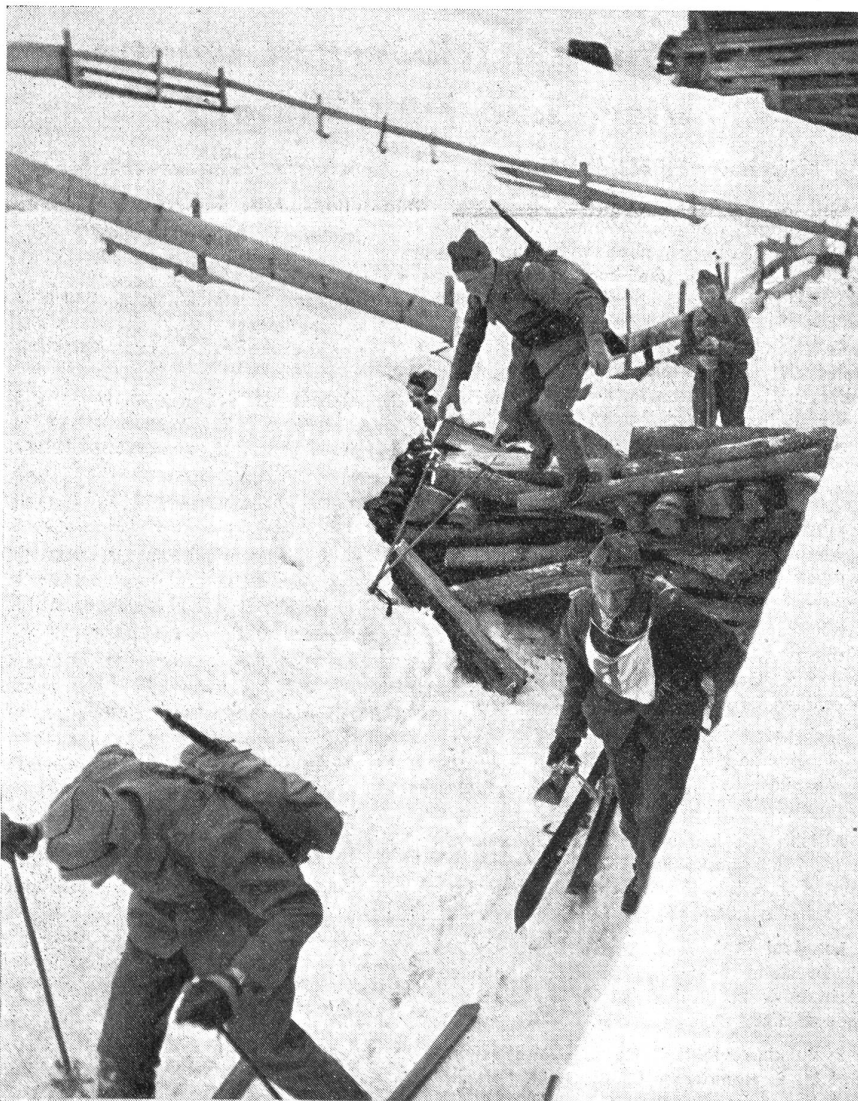
Überwinden einer Wegbarrikade während des Geländelaufes. (Z.-Nr. III Ae 7163.)