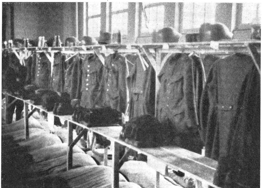
Vorbildliche Einrichtung eines großen Kantonementes. (Z.-Nr. VI R 11896.)

Es sei hier vorausgeschickt, daß viele Einheiten heute schon gewisse Arbeiten durch zugeteilte HD.-Leute ausführen lassen; dies scheint aber noch zu