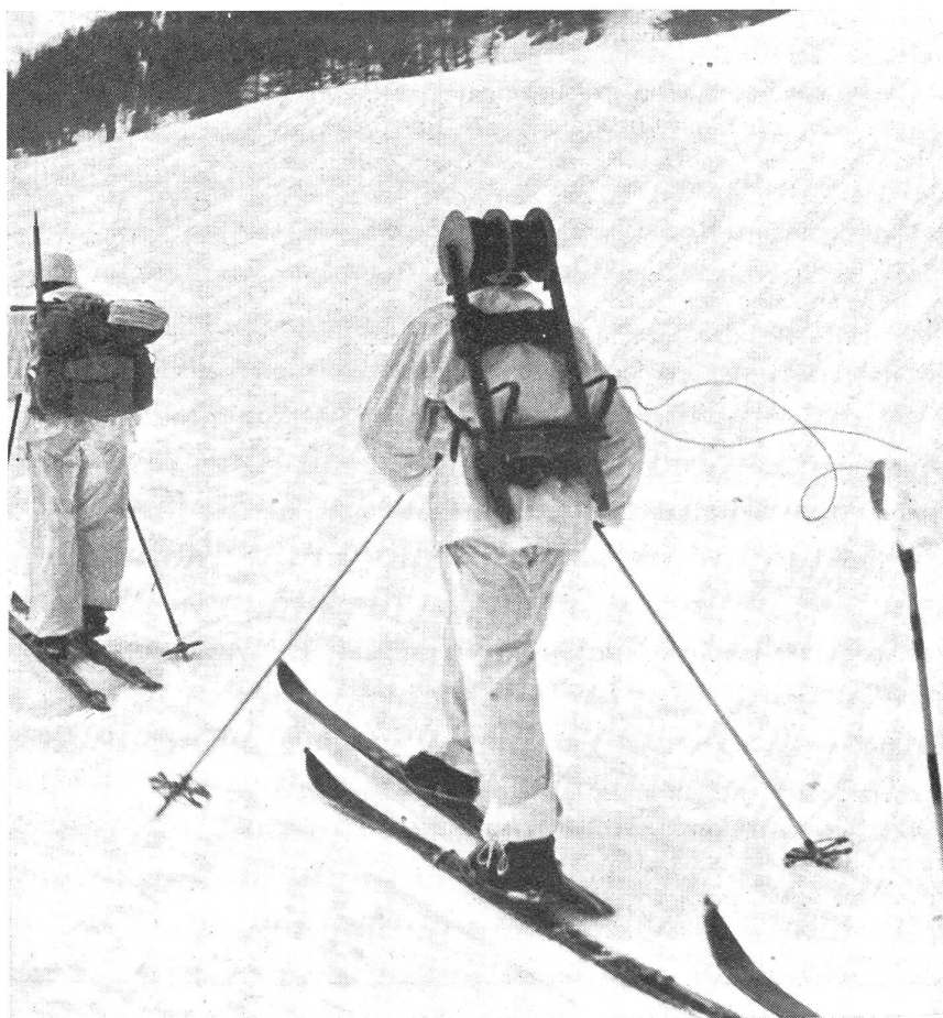
Bautrupps beim Vorbau einer doppeldrähtigen Stammlinie. (Z.-Nr. VI Br 9244.)

Von Natur aus sind es starke Ge- birgshindernisse, die dem entschlosse- nen Verteidiger Vorteil bieten. In den so vorbereiteten Stellungen muß die Truppe über ein geschützt angelegtes, verzweigtes Drahtnetz verfügen kön- nen. Dieses Drahtnetz soll nicht bereits beim ersten Massenfeuer den zur Si- cherung überlagerten Funk benötigen. Der Funk sollte für die Störung und teilweise Unterbindung des feindlichen Verkehrs, der auf die Kombination al- ler Nachrichtenmittel angewiesen ist, eingesetzt werden können, sowie für das Abhören, wenn nicht eine totale Funkstille nötig wird. Für den eigenen Verkehr soll er erst eingesetzt werden,