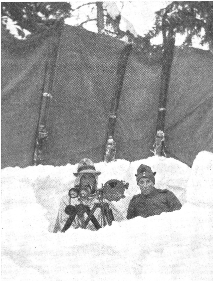
Eingegrabene Signalstation; die an eingerammten Skis ausgespannten Zelteinheiten wirken als Windschutz.

der Inf., mit Fahrrädern ausgerüstet, soweit dies die Straßenverhältnisse gestatten, dann zu Fuß und auf Skiern werden dauernd die Kolonnen unter sich und nach vorn mit dem Aufklärungsdef. verbinden. Die Bergrücken, Schluchten und tiefe Tobel bilden aber für die Ausbreitung der kurzen Wellen gerade die größten Hindernisse. Nur wenn die zwei Stationen in einem bestimmten Winkel zum Hindernis zueinander stehen, ist eine Verbindung möglich. Hindernisse sind aber immer da und diese wird der Funker nur durch den richtigen technischen Standortsbezug überbrücken, der vom taktisch richtigen Standort gewöhnlich stark abweicht. Dabei ist jedoch die größte Gefahr des feindlichen Abhorch-, Peil- und Stördienstes noch nicht berührt. Die Tatsache schält sich klar heraus, daß kein Nachrichtenmittel als ideal angesprochen werden kann, sondern