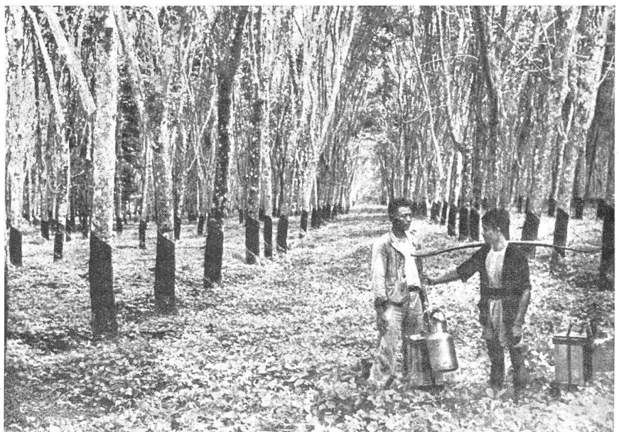
Gummigewinnung im Amazonasgebiet Brasiliens.

An dem Dakar zunächst gelegenen Küstenstreifen sind in letzter Zeit Befestigungsarbeiten durchgeführt worden. Mit amerikanischer Hilfe wurden außerdem Flugplätze angelegt. Sämtliche Häfen und Flugfelder sind ebenfalls befestigt. Brasilien erhält seit längerer Zeit unter den Bestimmungen des Pacht- und Leihgesetzes Tanks, Artillerie, Kampfwagen und Flugzeuge samt Zubehör aus den Vereinigten Staa-