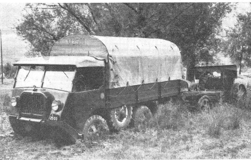
Geschützzug im Morast. Nur ein geländegängiges Fahrzeug wird in solchen Fällen die über 3 Tonnen schwere Motorkanone sicher in die befohlene Feuerstellung bringen. (Zensur-Nr. VI Vi 11635.)

schütze in die Stellungen zu ziehen, wird heute wohl kaum mehr in Frage kommen und darf gar nicht mehr verlangt werden. Der leitende Offizier muß heute soweit sein, daß er diese Auf-