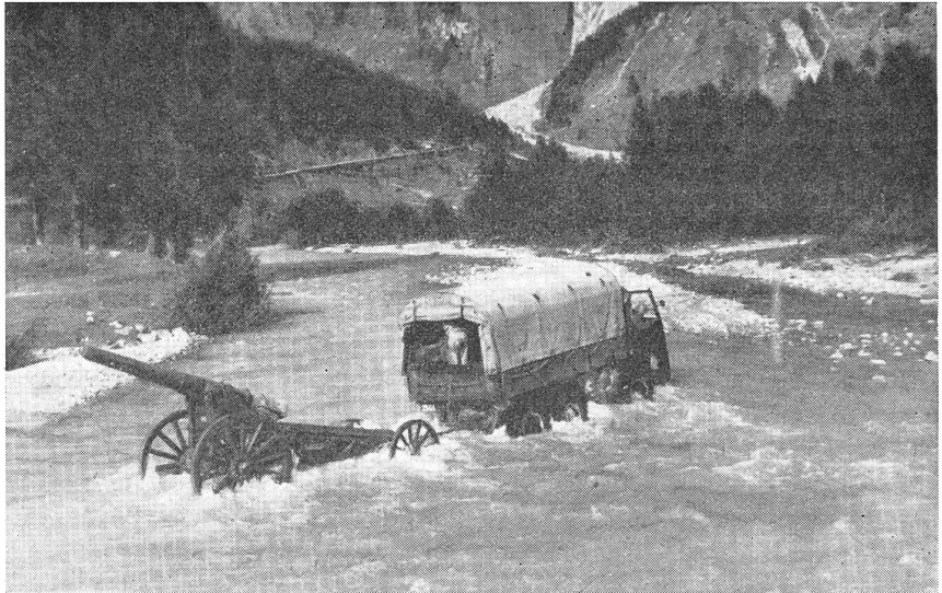
Durchqueren eines Bergflusses mittels geländegängigem Motorlastwagen. (Z.-Nr. VI Vi 11636.)

Vom Motorfahrer muß Mut, Ausdauer, Zähigkeit und Geschicklichkeit, Zuverlässigkeit, Selbständigkeit und technisches Wissen und Können verlangt werden. Es genügt also nicht, nur Fahrer zu sein. Der infanteristischen Ausbildung der Motorfahrer muß besondere Aufmerksamkeit geschenkt werden. Gewehr und Lmg. muß jeder Fahrer kennen und beherrschen. Ausbildung im Gelände sind der Theorie im Schulzimmer vorzuziehen. Die Ausbildung hat nur einen militärischen