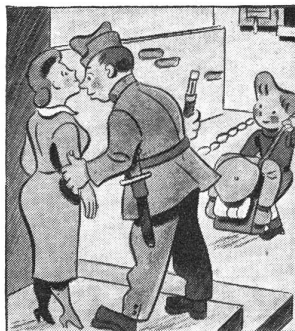
„Gelt, gib Sorg zu Dir, die kalten Nächte tun Dir nicht gut. Dass Du mir auch nur nicht zu viel rauchst!“