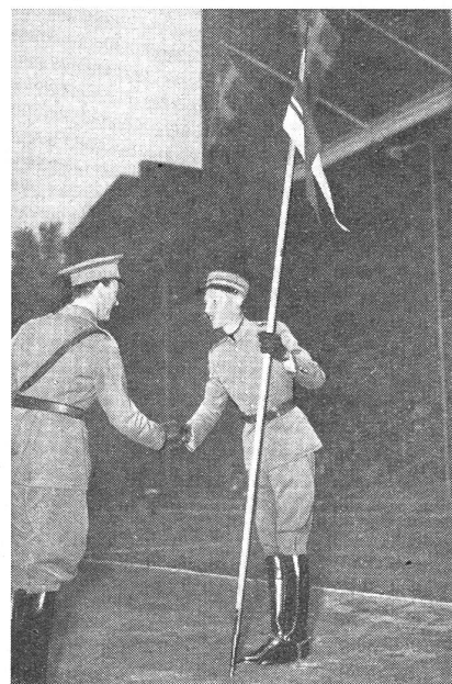
Erbprinz Gustav Adolf überreicht Oblt. Homberger den Ehrenpreis des Chefs der Schwedischen Armee, General Holmqvists.

Was die Härte und Ausdauer anbelangt, ist zu sagen, daß uns die Schweden gewaltig voraus sind. Dieser Vorsprung fängt aber schon in der Schule an, wo die Schweden dem Turnen gro-