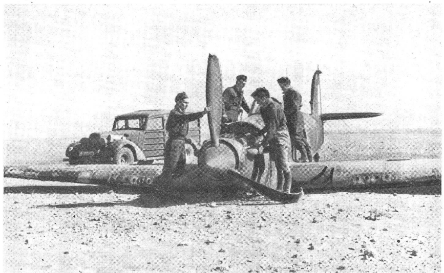
Eine abgeschossene «Hurricane» ist aufgefunden, die Beschädigungen sind aber zu schwer, um an Ort und Stelle behoben werden zu können. Ein Transportwagen wird angefordert.

Wenn deshalb ein Flugzeug von einem Patrouillenflug, oder von einer Operation nicht zurückkehrt, wird nach ihm gesucht. Meist weiß man ungefähr, wo es sich aufhielt, und dann ist es