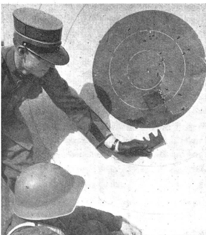
Erste Grundlagen der Schießausbildung: das Erkennen von Zielfehlern. (Z.-Nr. VI Vi 11074.)

Die Uebungen, die den genannten Zweck verfolgen, sind: