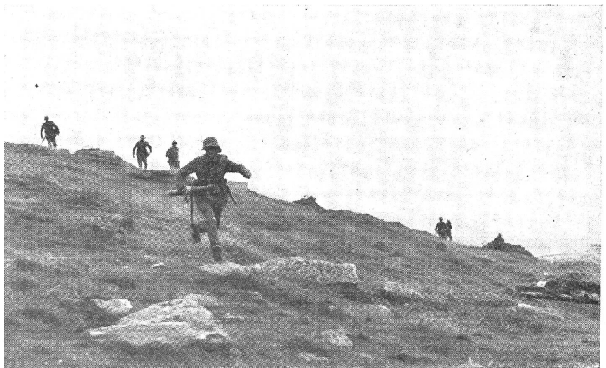
hastet tief und weit gestaffelt die Infanterie über das ungeschützte Glacis. (VI Br 10957)