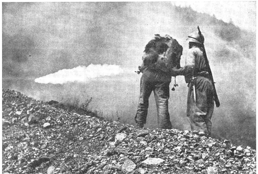
Flammenwerfertrupp im Einsatz gegen Panzerwagen. (N V 10596.)