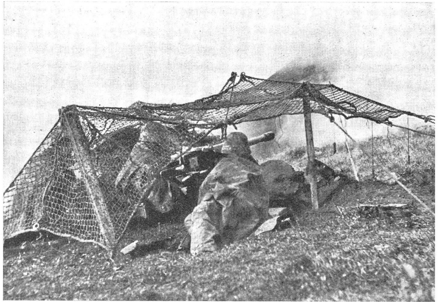
Ik. in Lauerstellung gegen Panzerwagen. (VI Br 10956.)

Hier greifen die Fliegerstaffeln ein. Zu zweien gepaart stoßen die schnell-