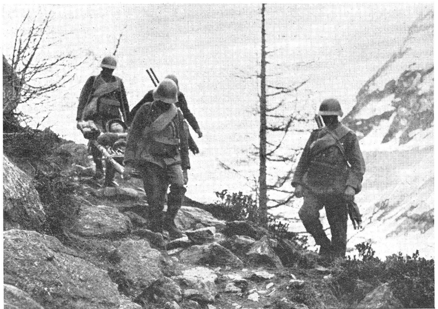
Bahrenttransport im Gebirge. (VI Br 8826.)

So besuchten wir eine derartige Bataillonsstelle auf einer Alp unmittelbar hinter der Abwehrstellung, die ein Gebirgsbataillon besetzt hatte. Selbstverständlich hatte der Kommandant dieses Sanitätsdetachements die Hilfsstelle so nahe als möglich bei dem Saumweg angelegt, der nach hinten, zur Haupt-Hilfsstelle des Regiments führte. Trotzdem gestaltete sich, wie man dies aus der Uebung ersehen konnte, der Transport der Verwundeten, der natürlich durch die rückwärtigen Sanitätspatrouil-