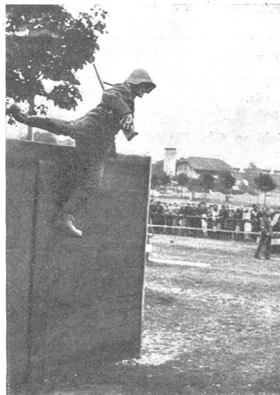
Flotter Sprung an der gefürchteten 2-m-Wand.

digt werden. Möge das Volk in großer Zahl mit seinen Soldaten den Ehrentag der Armee feiern! Z.