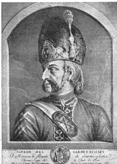
Sappeur des Schweizer Garderegimentes. Nach einem zeitgenössischen Stich. — Sappeur du régiment des gardes suisses, d'après une gravure de l'époque. — Zappatori del Reggimento di guardia svizzera.

Alle diese ungünstigen Momente vermochten die Haltung der Schweizergarde in keiner Weise zu beeinflussen. Weder Ueberredungsversuche noch Schmähungen und Beleidigungen machten die Schweizer schwankend in der Erfüllung ihrer soldatischen Pflicht. Sie harrten kaltblütig des Angriffs, sie verteidigten mit beispielloser Tapferkeit das Schloß, sie geleiteten den schwachen König durch die tobende Menge zur Nationalversammlung, wo er Schutz suchte, und sie legten auf seinen ausdrücklichen Befehl sogar die Waffen nieder, alles getreu dem geschworenen Soldateneid. Diese Treue zum Eid ist um so höher zu werten, als die Schweizer nicht für ihr Vaterland kämpften, sondern für einen fremden König, nicht Haus und Hof verteidigten, sondern