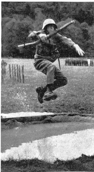
Ein rassischer Sprung über den Wassergraben. Zensur-Nr. VI Br 10377.

Wie zu erwarten war, ließ die Beteiligung zu wünschen übrig. Aus den Sektionen wie aus den bernischen Einheiten gingen die Meldungen nur spärlich ein. Die Vorbereitungszeit war eben für viele Wettkämpfer zu kurz, die nötige Kondition, die gerade beim Start zu einem militärischen Mehrkampf unbedingt erforderlich ist, konnte von vielen in den paar Wochen