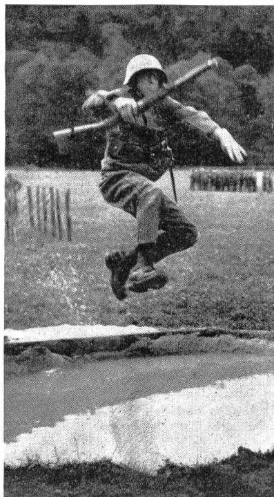
Ein rassischer Sprung über den Wassergraben. Zensur-Nr. VI Br 10377.

Wie zu erwarten war, ließ die Beteiligung zu wünschen übrig. Aus den Sektionen wie aus den bernischen Einheiten gingen die Meldungen nur spärlich ein. Die Vorbereitungszeit war eben für viele Wettkämpfer zu kurz, die nötige Kondition, die gerade beim Start zu einem militärischen Mehrkampf unbedingt erforderlich ist, konnte von vielen in den paar Wochen