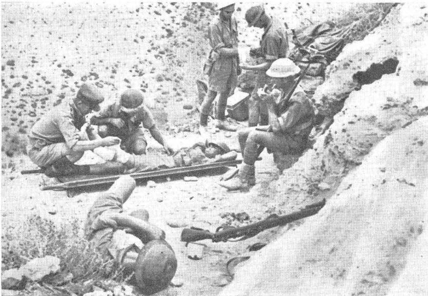
Verwundetennest in der Wüste. — Nid de blessés dans le désert. — Nido di feriti nel deserto.

uns herum trieben sich deutsche Tank- und Kampfwagenpatrouillen umher.