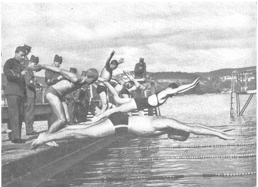
Rassiger Start der Fünfkämpfer zum 300-m-Freistilschwimmen. (Zens.-Nr. VI Br 10399.)

teilig auf die Ergebnisse auswirken würde, war von vornherein zu erwarten. Naturgemäß litten der Hindernislauf und das Handgranatenwerfen besonders unter diesen Umständen, insbesondere da manche Sektionen gar nicht über die nötigen Übungsplätze verfügen. Im Hindernislauf