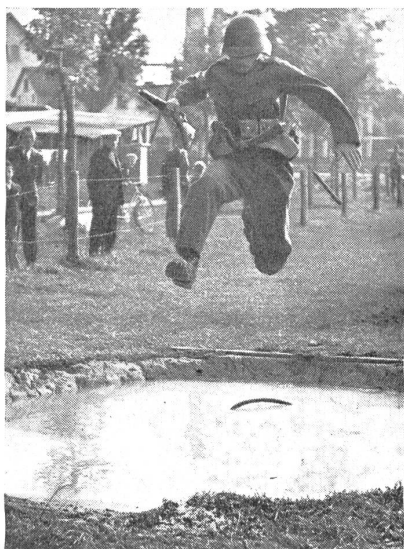
Sprung über den wassergefüllten Trichter. Nicht jedem Konkurrenten gelang der Sprung ohne Zwischenfall. (VI Br 10403.)