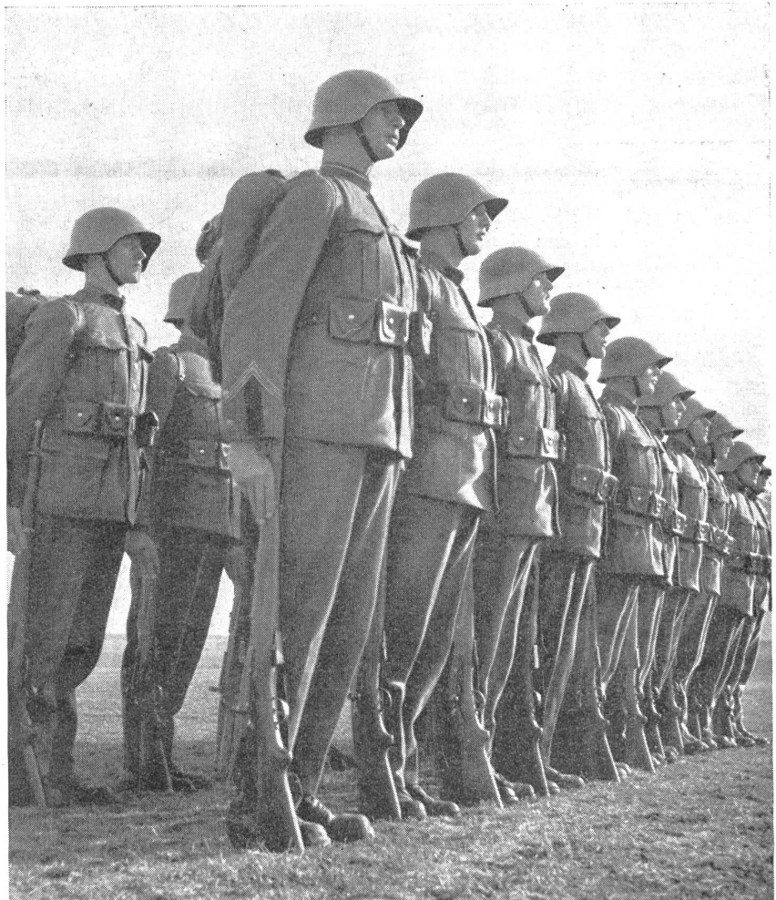
Der Korporal mit seiner Gruppe. — Le caporal avec son groupe. — Il caporale col suo gruppo. (Zens.-Nr. VI Br 8164.)

Im Kriege ist der Korporal mit seinen Mannen zu einer verschworenen Kampfeinheit geworden. Die Leute