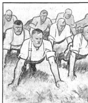
Aber auf's Morgenturnen freut sich die ganze Kompagnie; bei dem guten Kommando klappt es ausgezeichnet.