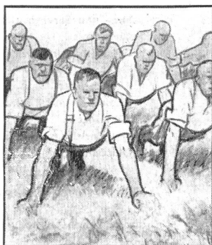
Aber auf's Morgenturnen freut sich die ganze Kompanie; bei dem guten Kommando klappt es ausgezeichnet.