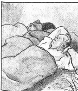
Das Aufstehen früh um 5 Uhr wird den älteren Soldaten nicht ganz leicht, die Glieder sind noch steif vom Pickeln und Schaufeln.