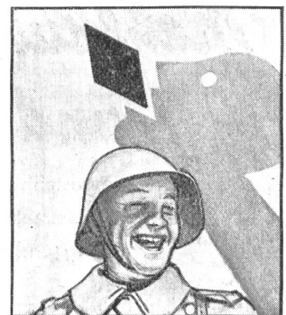
Er lässt sich halt immer Gaba von daheim schicken, denn er weiss: Gaba hält die Stimme klar.