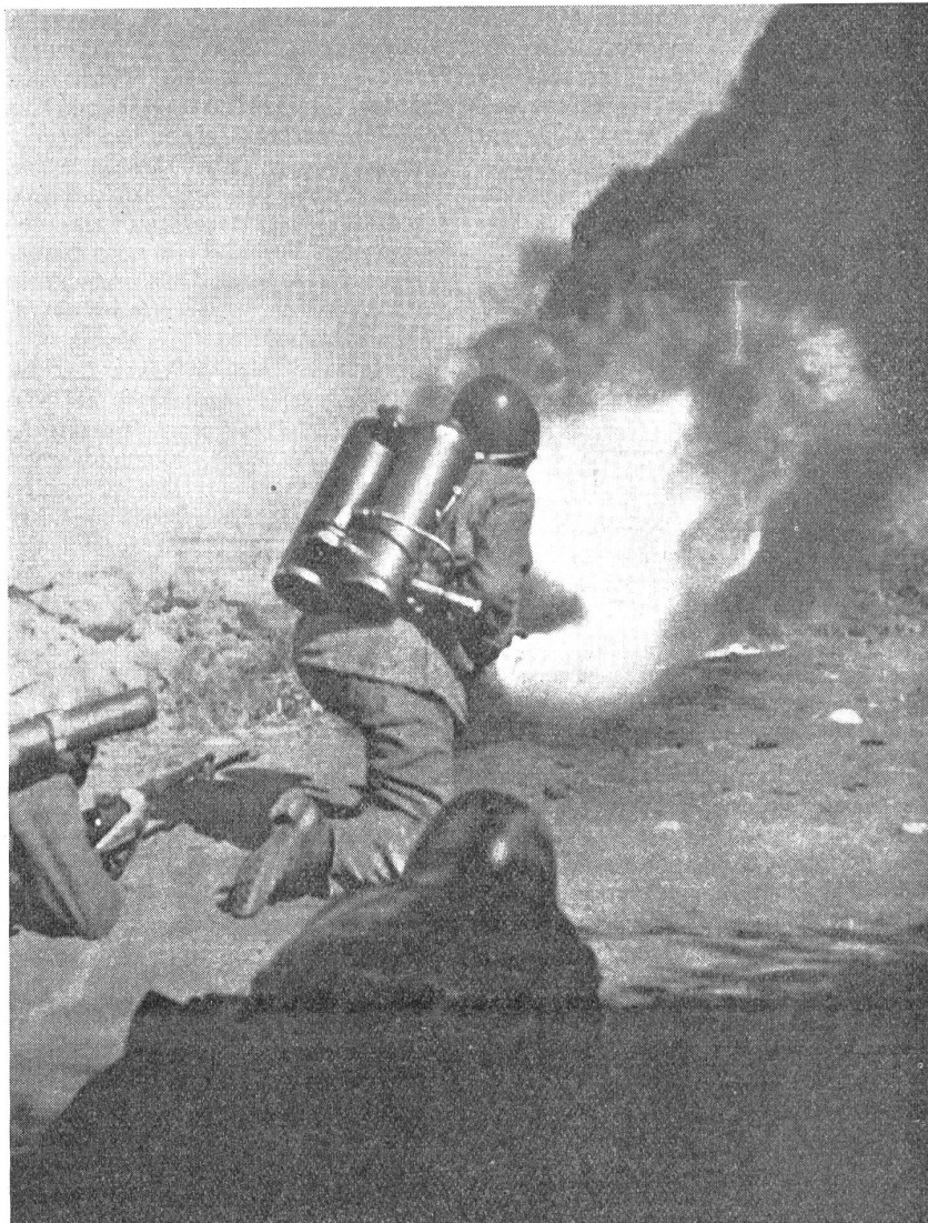
Moderner italienischer Feuerwerfer in Aktion. — Lance-flammes moderne italien en action. — Lanciamfiamme moderno italiano in azione.

Während aber auch nach Kriegsende 1918 in aller Stille an der Weiterentwicklung der kleinen, tragbaren Flammenwerfer gearbeitet wurde, schien man den großen, ortsfesten Geräten weniger Bedeutung mehr beizumessen. Sie hatten sich offenbar doch als zu unhandlich und zu schwerfällig erwiesen und infolgedessen für den als unter allen Umständen anzustrebenden Bewegungskrieg kaum geeignet. Dafür