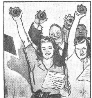
„Ja freilich, Gaba!“ Der kluge Sänger Gaba nimmt, Damit es mit der Stimme stimmt.