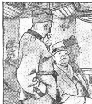
„Mich wundert nur, dass Ihr in dem Rauch singen könnt, ich werde stockheiser.“ — „Dafür nehmen wir Gaba, das lernt man beim Militär.“