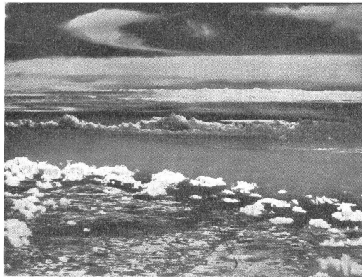
Infrarot-Aufnahme der französischen Küste von England aus; Standort des Flugzeuges über der Grafschaft Kent, Höhe 6000 Meter. — Vue de la côte française prise d'Angleterre par un avion volant au-dessus du Comté de Kent, à l'altitude de 6000 m. Foto infrarossa della costa francese dall'Inghilterra presa da aereo sopra la contea di Kent; altitudine 6000 m.

Rechts: Deutsches Fernkampf-Geschütz an der französischen Kanalküste beim Beschießen von Dover. — A droite: Canon allemand à longue portée, bombardant Douvres de la côte française. — A destra: Cannone tedesco a lunga portata. Pezzo piazzato sulla costa francese del Canale al bombardamento di Dover.