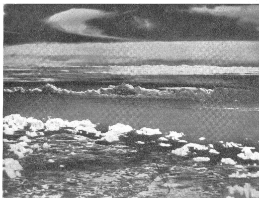
Infrarot-Aufnahme der französischen Küste von England aus; Standort des Flugzeuges über der Grafschaft Kent, Höhe 6000 Meter. — Vue de la côte française prise d'Angleterre par un avion volant au-dessus du Comté de Kent, à l'altitude de 6000 m. Foto infrarossa della costa francese dall'Inghilterra presa da aereo sopra la contea di Kent; altitudine 6000 m.

Rechts: Deutsches Fernkampf-Geschütz an der französischen Kanalküste beim Beschießen von Dover. — A droite: Canon allemand à longue portée, bombardant Douvres de la côte française. — A destra: Cannone tedesco a lunga portata. Pezzo piazzato sulla costa francese del Canale al bombardamento di Dover.