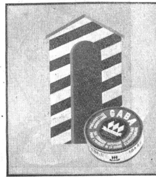
Gaba nehmen — Gaba nützt, Gaba schicken — Gaba schützt.