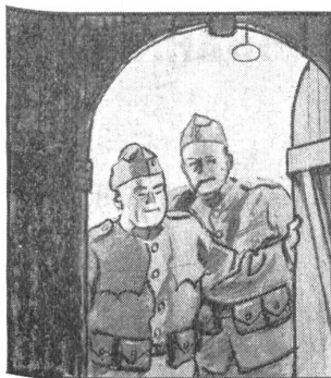
's wär schon recht, das Kantonnement, Platz genug und frisches Stroh, — aber zügig ist es.

Un tenente di un Reggimento di artiglieria da montagna, la terza notte della battaglia, avendo ormai il comando deciso di fiaccare ad ogni costo la resistenza nemica e di occupare senz'altro il villaggio di X. con un pugno di uomini, volentieri e come lui audaci, è riuscito ad infiltrarsi in un boschetto di acacie, al di là delle stesse linee nemiche e poco distante da una delle più munite ridotte avversarie, quella che rappresentava il centro sostegno di tutta la difesa. Carponi, nella notte, trattenendo il respiro, soffermandosi, ripigliando a strisciare, per poi giunti alle prime acacie scattare improvvisamente sulle sentinelle rosse, ucciderle all'arma bianca e rapidi, senza esitazioni che avrebbero potuto perderli, soffocando qualsiasi rumore, facendo attenzione a che nemmeno il fruscio delle foglie si potesse udire, segnalare alle proprie artiglierie l'esatta posizione della ridotta nemica, ecco il compito affidato a questi che nel